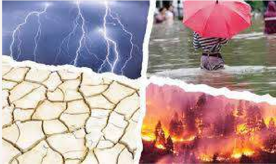
వేద న్యూస్ దెన్కె:

ప్రపంచవ్యాప్తంగా వాతావరణ మార్పులు, పర్యావరణ పరిరక్షణపై అవగాహన పెంచేందుకు అనేక అంతర్జాతీయ సంస్థలు ప్రత్యేక కార్యక్రమాలు నిర్వహిస్తున్నాయి. ఈ కార్యక్రమాలు కేవలం ఒక రోజు కార్యక్రమాలుగా కాకుండా, భూమి భవిష్యత్తును కాపాడుకోవాలన్న బాధ్యతను ప్రపంచానికి గుర్తుచేసే ప్రయత్నంగా మారుతున్నాయి. ప్రకృతి వనరుల వినియోగం పెరుగుతున్న నేపథ్యంలో పర్యావరణ పరిరక్షణ అత్యవసరం అవగాహన మారింది. ఇటీవలి సంవత్సరాల్లో వాతావరణ మార్పుల ప్రభావం ప్రపంచవ్యాప్తంగా స్పష్టంగా కనిపిస్తోంది. అసాధారణ ఉష్ణోగ్రతలు, వరదలు, కరువులు, తుఫానులు, అడవుల అగ్నిప్రమాదాలు వంటి ప్రకృతి విపత్తులు తరచుగా చోటుచేసుకుంటున్నాయి. ఇవి కేవలం ప్రకృతి సంఘటనలు మాత్రమే కాకుండా, మానవ కార్యకలాపాల వల్ల ఏర్పడిన పర్యావరణ అసమతుల్యతకు సంకేతాలుగా భావిస్తున్నారు. పరిశ్రమల విస్తరణ, అడవుల నరికితే, కాలుష్యం పెరగడం వంటి కారణాలతో భూమి ఉష్ణోగ్రతలు ప్రమాదంగా పెరుగుతున్నాయి. దీనివల్ల సముద్ర మట్టం పెరగడం, మంచు పర్వతాలు కరుగడం, జీవ వైవిధ్యం తగ్గిపోవడం వంటి సమస్యలు ఎదురవుతున్నాయి. ఈ పరిస్థితులు కొనసాగితే భవిష్యత్తులో మానవ జీవనంపై తీవ్ర ప్రభావం పడే అవకాశమందని పర్యావరణ నిపుణులు హెచ్చరిస్తున్నారు.