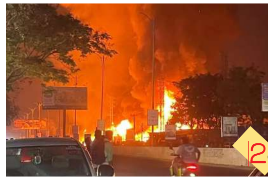
బాచుపల్లిలో భారీ అగ్నిప్రమాదం కోట్ల రూపాయల ఆస్తి నష్టం

వరంగల్ | గురువారం | పేజీలు 5 సంపుటి: 4 సం.చిక:79 | మార్చి 05, 2026 | వెల: రూ.3-00