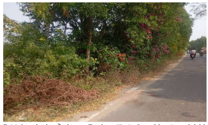
పెరిగిన ముళ్ల పొదలు, చెట్లను తొలగించి రహదారి భద్రతను మెరుగుపర్చాలని వాహనదారులు సంబంధిత అధికారులను కోరుతున్నారు

రాజన్న సిరిసిల్ల జిల్లా చందుర్తి మండల కేంద్రంలోని మండల పరిషత్ కార్యాలయానికి కూతవేలు దూరంలో ఉన్న రహదారిపై ఇరువైపులా కాగితం పూల చెట్లు, ముళ్ల పొదలు ఏవుగా పెరిగి ప్రమాదకరంగా మారుతున్నాయి. చూడటానికి అందంగా కనిపిస్తున్నప్పటికీ, ఈ చెట్లు మూలములుపుల వద్ద ఎదురు నుంచి వచ్చే వాహనాలు కనిపించకుండా అడ్డుగా నిలుస్తున్నాయని స్థానికులు, ప్రయాణికులు ఆవేదన వ్యక్తం చేస్తున్నారు. ఇటీవల మూలములుపుల వద్ద ఎదురుగా వచ్చే వాహనాలు స్పష్టంగా కనిపించక పోవడంతో రోడ్డు ప్రమాదాలు చోటుచేసుకున్నాయని వారు తెలిపారు. ఈ రహదారి మీదుగా చందుర్తి మండల కేంద్రం పాటు పరిసర ప్రాంతాలకు నిత్యం అనేక మంది ప్రయాణికులు ప్రయాణాలు చేస్తుంటారు. రోడ్లకు ఇరువైపులా