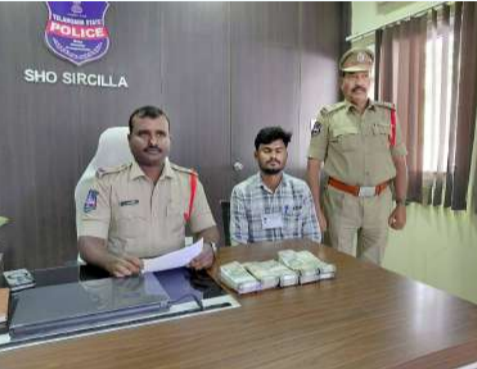
వేద న్యూస్, రాజన్న సిరిసిల్ల:

- చెక్పోస్ట్ వద్ద పట్టుబడ్డ లెక్కలేని నగదు