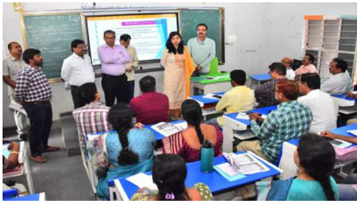
వేద న్యూస్, రాజన్న సిరిసిల్ల: