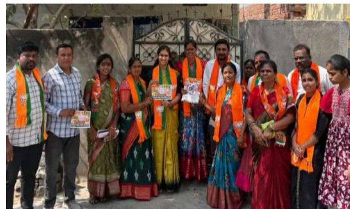
వేద న్యూస్, వేములవాడ:

వేములవాడ మున్సిపల్ ఎన్నికల ప్రచారంలో భాగంగా శుక్రవారం 19వ