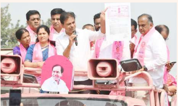
వేద న్యూస్, హైదరాబాద్

ముఖ్యమంత్రి రేవంత్ రెడ్డి పన్నుతగ్గు తిట్ల ట్రాప్ లో పడరాదు పదే పదే బీఆర్ఎస్ వర్కౌట్ పై సీఎం రేవంత్ కేటీఆర్ కల్యాణం కారక రామారావు పార్టీ శ్రేణులకు పిలుపునిచ్చారు. మున్సిపల్ ఎన్నికల వేళ ప్రభుత్వ వైఫల్యాలూ, హామీల అమలులో జరిగిన మోసాన్ని కచ్చితంగా పదే పదే నిరూపించాలని సీఎం రేవంత్ కేటీఆర్ కు సూచించారు. తెలంగాణ ఇంజనీరింగ్ కాలేజీలను గేట్ పాటు పోరాడిన నాయకుడు కేసీఆర్ అని, రాష్ట్రాన్ని ప్రగతి బాటలో నడిపించిన మహానీతి శిల్పి ఆయననే కేటీఆర్ గుర్తు చేశారు. కేసీఆర్ వ్యక్తిత్వంపై దాడి చేయడం తెలంగాణ ఉద్యమ చరిత్రపై దాడి చేయడమేనని వ్యాఖ్యానించారు. అందుకే పార్టీ కార్యకర్తలు అప్రమత్తంగా ఉండాలని సూచించారు. రాజీవ్ మున్సిపల్ ఎన్నికల్లో చర్చ జరగాల్సి వచ్చినప్పుడు మౌలిక వసతులు, రోడ్లు, డ్రైనేజీ,