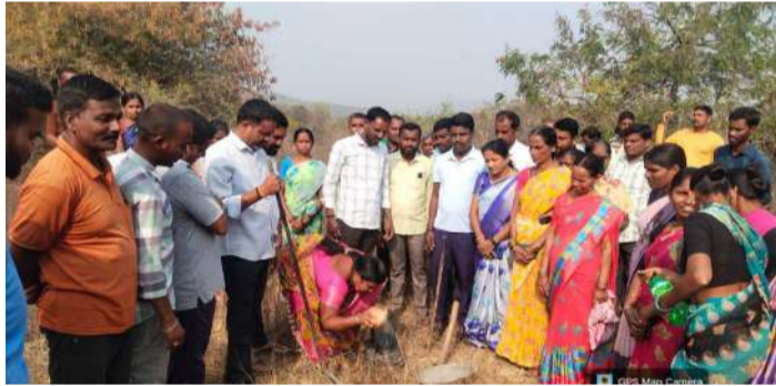
వేద న్యూస్, ఇల్లంతకుంట: