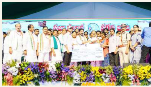
వేద న్యూస్, నిజామాబాద్