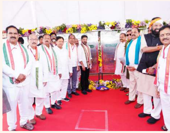
వేద న్యూస్, నిజామాబాద్

పేద, బడుగు, బలహీన వర్గాల విద్యార్థులకు నాణ్యమైన, అంతర్జాతీయ స్థాయి విద్య అందించడమే లక్ష్యంగా ప్రభుత్వం ముందుకు సాగుతోందని సీఎం రేవంత్ తెలిపారు. నిజామాబాద్ జిల్లా ఆర్కాడ్, బోధన్, నిజామాబాద్ రూరల్ అసెంబ్లీ నియోజకవర్గాల్లో ప్రతి నియోజకవర్గానికి రూ.200 కోట్ల చొప్పున మొత్తం రూ.600 కోట్లతో యంగ్ ఇండియా ఇంటిగ్రేటెడ్ రెసిడెన్షియల్ సూపర్ నిర్మాణానికి ముఖ్యమంత్రి ఏ. రేవంత్ రెడ్డి శంకుస్థాపన చేశారు. ప్రజాపాలన ప్రగతి బాట కార్యక్రమంలో భాగంగా డిసెంబర్ 1 మండలం బర్లిన్లో ఏర్పాటు చేసిన బహిరంగ సభలో సీఎం రేవంత్ మాట్లాడుతూ.. నిజామాబాద్ జిల్లా వ్యవసాయం దేశానికే ఆదర్శంగా నిలుస్తోందని ప్రశంసించారు. రైతుల కృషి వల్ల జిల్లాకు ప్రత్యేక గుర్తింపు వచ్చిందని పేర్కొన్నారు. జిల్లాలో పెండింగ్లో ఉన్న అభివృద్ధి ప్రాజెక్టులను పూర్తి చేయడానికి అవసరమైన నిధులు మంజూరు చేస్తామని భరోసా ఇచ్చారు. ఈ సందర్భంగా ఇందూరు జిల్లా మహిళా సమాఖ్యకు చెందిన 1,614 స్వయం సహాయక సంఘాలకు రూ.200 కోట్ల బ్యాంక్ లింకేజీ చెక్కును సీఎం రేవంత్ అందజేశారు. మహిళా సంఘాల ఆర్థిక బలోపేతమే లక్ష్యంగా ప్రభుత్వం పని చేస్తోందని తెలిపారు. అలాగే తెలంగాణ యూనివర్సిటీలో ఎన్నో బాలురు, బాలికల హాస్టళ్లు, ఇండోర్ స్టేడియం, ఆడిటోరియం, సైన్స్ ల్యాబ్ల ప్రారంభం, రోడ్ల విస్తరణ వంటి పలు అభివృద్ధి పనులకు శంకుస్థాపన చేశారు. జిల్లా అభివృద్ధికి నూటికి నూరు శాతం కృషి చేస్తామని సీఎం రేవంత్ చెప్పారు.