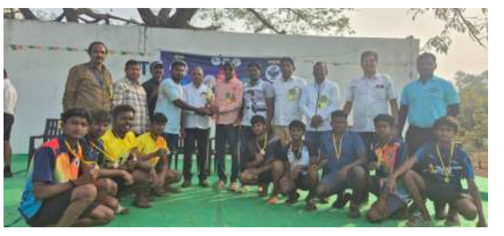
వేద న్యూస్, బోయినపల్లి: