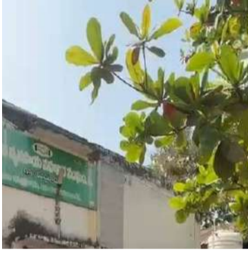
వేద న్యూస్, రుద్రూర్:

రుద్రూర్ మండల కేంద్రంలో పాటు చుట్టు పక్కల గ్రామాలకు చెందిన రైతులకు ప్రాథమిక వ్యవసాయ సహకార సంఘంలో యూరియా కొరత ఏర్పడటంతో తీవ్ర ఇబ్బందులు ఎదురవు