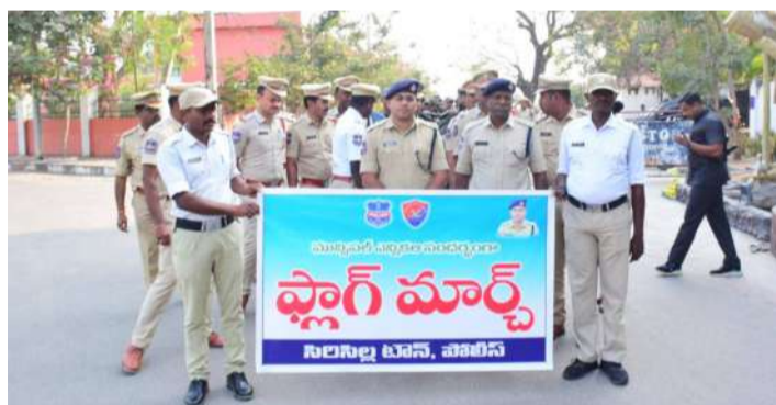
వేద న్యూస్, రాజన్న సిరిసిల్ల: