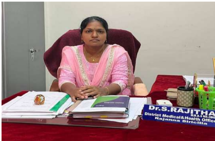
వేద న్యూస్, రాజన్న సిరిసిల్లా: