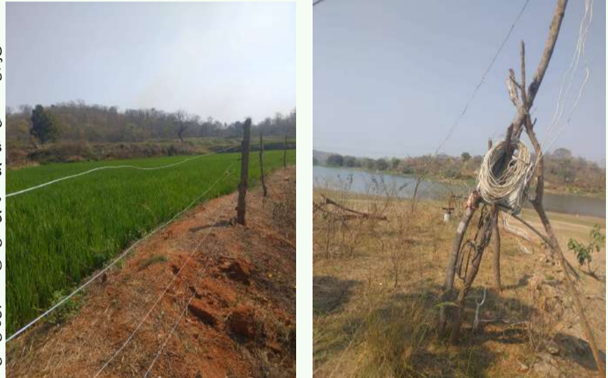
వేద న్యూస్, కోనరావుపేట:

రాజన్న సిరిసిల్ల జిల్లా కోనరావుపేట మండలం నిమ్మపల్లి గ్రామంలో భూములు, చెరువులు భూకబ్బాదారుల బారిన పడుతున్నాయని స్థానికులు ఆవేదన వ్యక్తం చేస్తున్నారు. గ్రామ సమీపంలోని చెరువు ఉప్పురివాడ ప్రాంతంలో భారీ స్థాయిలో భూములు ఆక్రమణకు గురవుతున్నప్పటికీ అధికారులు పట్టించుకోవడం లేదని ఆరోపిస్తున్నారు. భూకబ్బాదారులు విచ్చలవిడిగా భూములను ఆక్రమిస్తున్నారని, దీనిపై అడిగి వారు లేకపోవడంతో పరిస్థితి మరింత దారుణంగా మారిందని గ్రామస్థులు చెబుతున్నారు. కొందరు మాజీ ప్రజాప్రతినిధులు కూడా డబ్బులు తీసుకుని కబ్బాదారులకు మద్దతు ఇస్తున్నారని ఆరోపిస్తున్నారు. గ్రామంలోని ఊర చెరువు, అలాగే బయట ఉన్న పెద్ద చెరువు ప్రాంతాల్లో కూడా అక్రమంగా మోటార్లు ఏర్పాటు చేసి వేల ఎకరాలకు నీరు సరఫరా చేస్తున్నట్లు స్థానికులు తెలిపారు. ఈ వ్యవహారంలో కొంతమంది అధికారులు లంచాలు తీసుకుని అక్రమాలను పట్టించుకోవడం లేదని ఆరోపించారు. ఇప్పటికైనా సంబంధిత అధికారులు క్షేత్రస్థాయిలో విచారణ జరిపి చెరువుల్లో అక్రమంగా ఏర్పాటు చేసిన బోర్లు, మోటార్లను తొలగించి, అక్రమ విద్యుత్ కనెక్షన్లు ఇచ్చిన వారిపై చర్యలు తీసుకోవాలని గ్రామస్థులు డిమాండ్ చేస్తున్నారు.