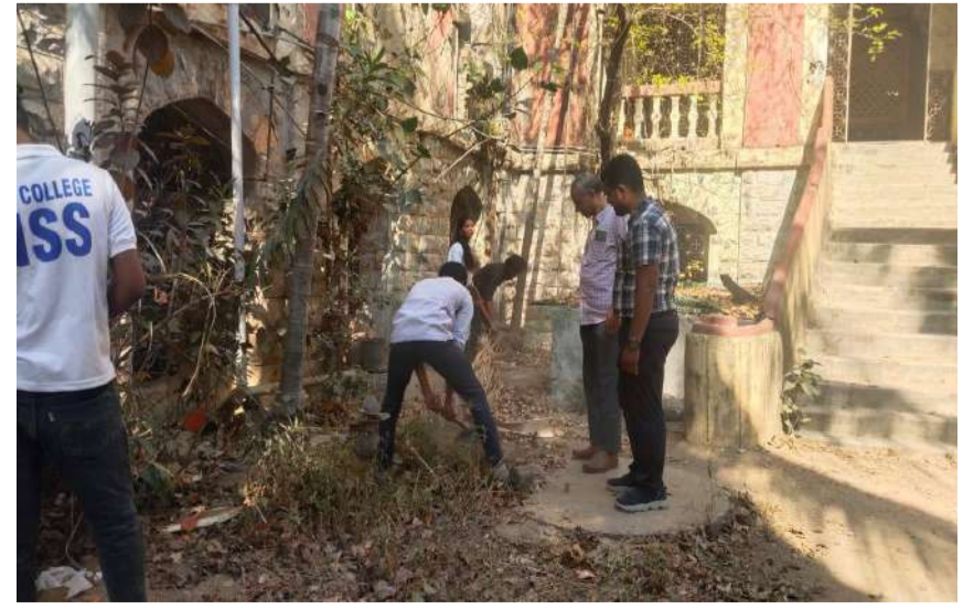
వేద న్యూస్, హైదరాబాద్: