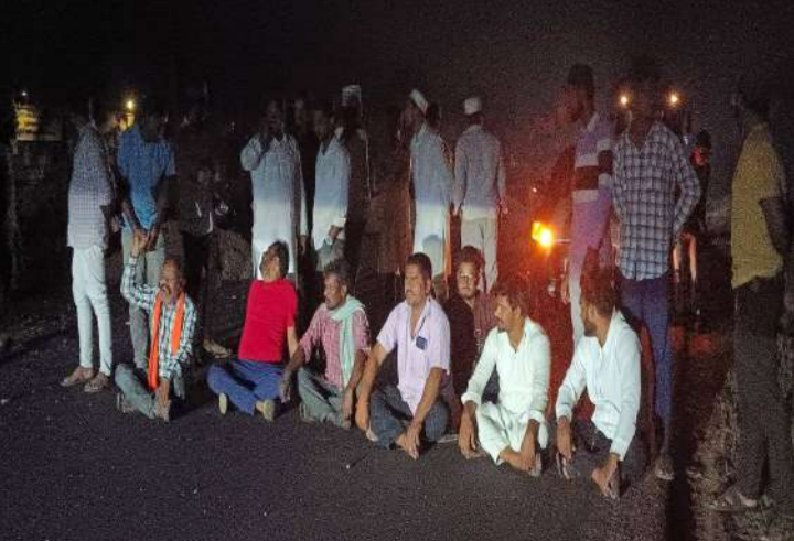
వేద న్యూస్, రుద్రూర్:

రుద్రూర్-వర్ని రహదారి పనులు కొనసాగుతున్న నేపథ్యంలో రోడ్డు నిర్మాణ సంస్థ రహదారిపై ఎలాంటి సూచిక బోర్డులు ఏర్పాటు చేయకపోవడంతో తరచూ ప్రమాదాలు సంభవిస్తున్నాయని గ్రామస్థులు ఆరోపిస్తున్నారు. రోడ్డుకితే చాలు సురక్షితంగా గమ్యం చేరతామా లేదా అనేది ప్రశ్నార్థకంగా మారుతోంది. ఏ వైపు నుంచి మృత్యువు వెంబడిస్తుందో తెలియని దుస్థితి. పొంచిఉన్న ప్రమాద ప్రాంతాలు దీనికి తోడు రోడ్డు నిర్మాణ సంస్థ సరైన నిబంధనలు పాటించక నిండు ప్రాణాలు గాలిలో కలిసిపోతున్నాయి. రుద్రూర్ మండలం అక్కర్ నగర్ ఫుడ్ సైన్స్ కాలేజీ ముందు ఫిబ్రవరి 28న రాత్రి సమయంలో రోడ్డు పై పోసిన మొరం కుప్ప పై పడి కత్తి గంగారం తీవ్రంగా గాయపడి చికిత్స పొందుతూ నిజామాబాద్ ప్రవేల్ ఆసుపత్రిలో శుక్రవారం ఉదయం మృతి చెందారు. ఏలాంటి సూచిక బోర్డులు ఏర్పాటు చేయకుండా నడిరోడ్డుపై మొరం కుప్పలు వేయడంతో అదే