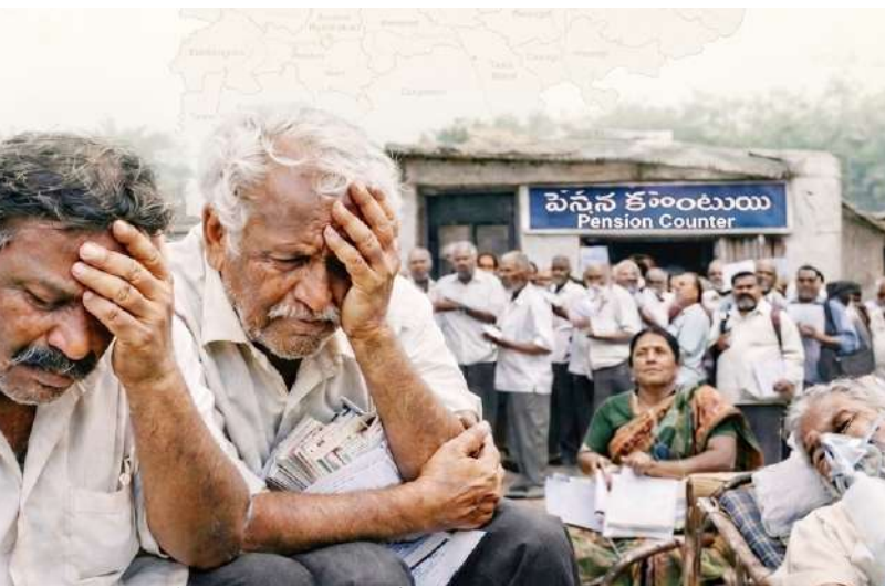
ఈ వృద్ధులు బతికే ఉంటారా? అని ఉద్యోగ సంఘాలు నిలదీస్తున్నాయి.

తెలంగాణలో గత మార్చి 2024 నుంచి నేటి వరకు రిటైర్మెంట్ సుమారు 24,678 మంది ఉద్యోగుల పరిస్థితి అత్యంత దారుణంగా తయారైంది. వీరికి రావాల్సిన గ్రాంటు, ఎన్ క్యాష్ మెంట్, జీఎల్ బీసీ, కమ్యూనిటీషన్ సహా ఇతర ప్రయోజనాలన్నీ పెండింగ్ లో ఉన్నాయి. ప్రభుత్వం రిటైర్డ్ ఉద్యోగులకు సుమారు రూ.10వేల కోట్ల బకాయిలు చెల్లించాల్సి ఉంది. నెలకు రూ.700 కోట్లు విడుదల చేస్తామని ప్రభుత్వం హామీ ఇచ్చినప్పటికీ, అది మాటలకే పరిమితమైంది. ఇదే వేగంతో చెల్లింపులు జరిగితే, మొత్తం బకాయిలు తీరడానికి మరో పదేళ్లు పడుతుందని, అప్పటి వరకు