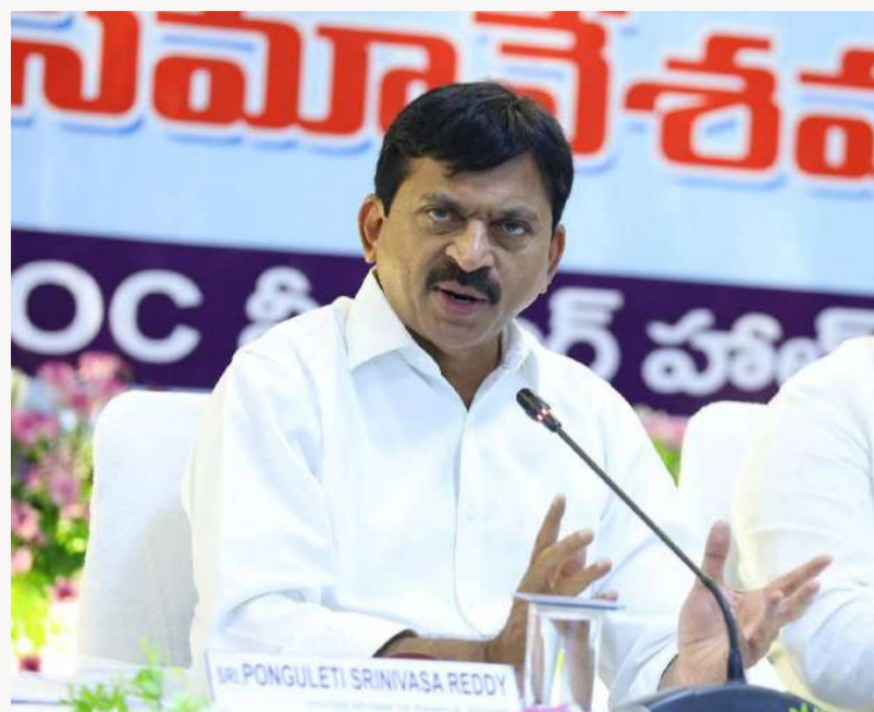
వేద న్యూస్, ఖమ్మం ప్రతినిధి:

ప్రజలకు మేలైన పాలన అందించాలనే లక్ష్యంతో ప్రభుత్వం ప్రవేశపెట్టిన ప్రజా పాలన - ప్రగతి ప్రణాళిక 99 రోజుల ప్రత్యేక కార్యచరణను విజయవంతం చేయాలని తెలంగాణ రెవెన్యూ, గృహ నిర్మాణం, సమాచార శాఖల మంత్రి పొంగులేటి శ్రీనివాసరెడ్డి పిలుపునిచ్చారు. శుక్రవారం ఖమ్మం ఐడిఓసీ సమావేశ మందిరంలో జిల్లా ఇన్-చార్జ్ మంత్రి వాకిలి శ్రీహరి ఆధ్వర్యంలో ఉమ్మడి ఖమ్మం జిల్లా సన్నాహక సమావేశం నిర్వహించారు. ఈ సందర్భంగా మంత్రి పొంగులేటి మాట్లాడుతూ క్షేత్రస్థాయిలో ప్రజలు ఎదుర్కొంటున్న సమస్యలను గుర్తించి, వాటి పరిష్కారానికి