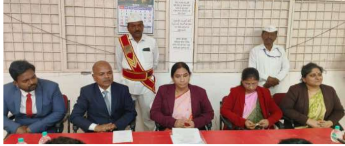
వేద న్యూస్, రాజన్న సిరిసిల్ల: