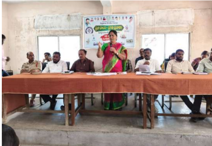
కూడా అధికారులు వివరించారు. వేసవి కాలాన్ని దృష్టిలో ఉంచుకుని సమగ్ర యాక్షన్ ప్లాన్ తో పాటు ప్రజా పాలన-ప్రగతి ప్రణాళిక 99 రోజుల కార్యక్రమం అమలుపై సమగ్రంగా అవగాహన కల్పించారు.

రాజన్న సిరిసిల్ల జిల్లా బోయినిపల్లి మండలంలో జిల్లా కలెక్టర్ ఆదేశాల మేరకు శుక్రవారం మండల ప్రజా పరిషత్ కార్యాలయంలో ప్రజా పాలన-ప్రగతి ప్రణాళికపై అవగాహన సమావేశం నిర్వహించారు. ఈ సమావేశాన్ని మండల పరిషత్ అభివృద్ధి అధికారి అధ్యక్షులు నిర్వహించగా, మండలంలోని సర్పంచులు, గ్రామపంచాయతీ కార్యదర్శులు, వివిధ శాఖల అధికారులు పాల్గొన్నారు. ఈ సందర్భంగా అధికారులు మాట్లాడుతూ మార్చి 6 నుంచి మార్చి 15 వరకు పంచాయతీ రాజ్ శాఖ అధ్యక్షులు గ్రామాల్లో ప్రత్యేక డ్రైవ్ నిర్వహించనున్నట్లు తెలిపారు. గ్రామాల్లో రోడ్ల శుభ్రత, డ్రైనేజీల శుభ్రపరిచే పనులు, బస్ స్టాండ్ల పరిశుభ్రత వంటి కార్యక్రమాలు చేపట్టనున్నట్లు పేర్కొన్నారు. ఆదేవిధంగా ప్రజా పాలన, ఫుడ్ సెక్యూరిటీ, గృహజ్యోతి, గ్యాస్ సిలిండర్ వంటి ప్రభుత్వ పథకాల వివరాలను గ్రామాల వారీగా సమారు చేయనున్నట్లు తెలిపారు. బోయినిపల్లి, కొడురుపాక, విలాసాగర్ గ్రామాల్లో ప్రత్యేక వైద్య శిబిరాలు నిర్వహించేందుకు ఐదుగురు సభ్యులతో వైద్య బృందాన్ని ఏర్పాటు చేయనున్నట్లు వెల్లడించారు. విద్యుత్ స్తంభాల మరమ్మత్తులు, రెవెన్యూ సమస్యల పరిష్కారం, పంట మార్పు, అయిల్ పామ్ సాగు ప్రోత్సాహం, మట్టి నాణ్యత పరీక్షలు వంటి అంశాలపై