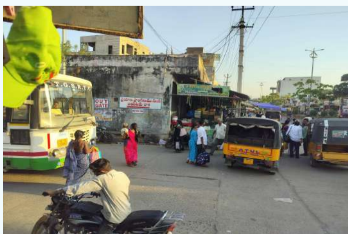
స్థానికులు ఆవేదన వ్యక్తం చేస్తున్నారు. ప్రతిరోజూ వందలాది మంది ప్రయాణికులు ఈ బస్ స్టాండ్ ను వినియోగిస్తున్నప్పటికీ సమస్యలను పరిష్కరించేలా అధికారులు చర్యలు తీసుకోకపోవడం విమర్శలకు దారితీస్తోంది. ఇప్పటికైనా ఆర్టీసీ అధికారులు స్పందించి ట్రాఫిక్ సమస్యలను పరిష్కరించే అవకాశం ఉందని నియంత్రణకు చర్యలు తీసుకోవాలని ప్రజలు కోరుతున్నారు.

బాన్సువాడ పట్టణంలోని ప్రధాన ఆర్టీసీ బస్ స్టాండ్ వద్ద రోజురోజుకూ ట్రాఫిక్ సమస్యలు పెరుగుతున్నాయి. బస్ స్టాండ్ అవుట్ గేట్ వద్ద ఆటోలు, ఇతర వాహనాలు అడ్డంగా నిలబడటంతో బస్సులు బయటకు రావడంలో తీవ్ర ఇబ్బందులు ఎదురవుతున్నాయి. బస్ స్టాండ్ వద్ద ట్రాఫిక్ సిగ్నల్ ఉన్నప్పటికీ ఆటో డ్రైవర్లు దాన్ని పట్టించుకోకుండా ఎక్కడ పడితే అక్కడ వాహనాలు నిలబెట్టి ప్రయాణికులను ఎక్కించుకోవడంతో ట్రాఫిక్ గందరగోళంగా మారుతోంది. ఆదేవిధంగా బస్ స్టాండ్ వద్ద కనీసం ఒక సెక్యూరిటీ గార్డు కూడా లేకపోవడంతో పరిస్థితి మరింత ఆందోళనకరంగా మారింది. బస్సులు బయటకు వస్తున్న సమయంలో ప్రయాణికులు రోడ్డుపై తిరుగుతుండటంతో ఎప్పుడైనా ప్రమాదం జరిగే అవకాశం ఉందని