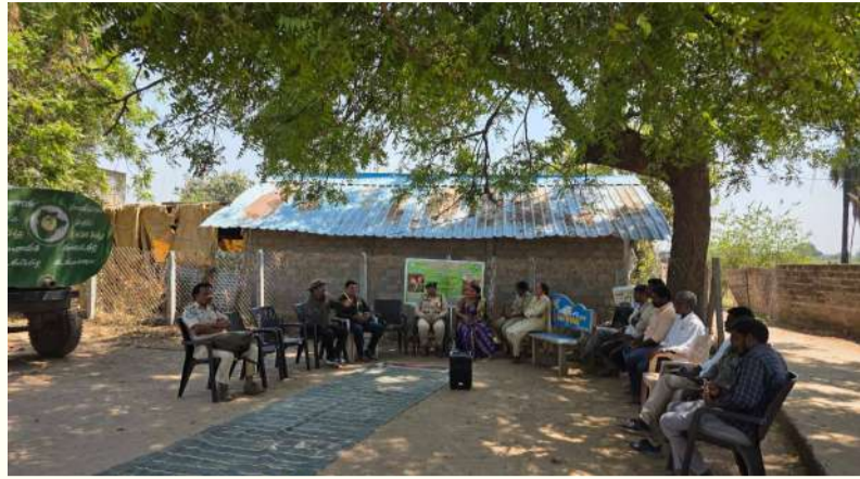
వేద న్యూస్, మంచినీటి:

మంచినీటి జిల్లా దండేపల్లి మండలంలోని అటవీ ప్రాంతమైన కర్లపేటలో అటవీశాఖ మరియు ఓరుగల్లు వైల్డ్ లైఫ్ సొసైటీ సంయుక్త ఆధ్వర్యంలో వన్యప్రాణుల సంరక్షణపై ప్రత్యేక అవగాహన కార్యక్రమం నిర్వహించబడింది. వేసవి కాలం ప్రారంభమైన నేపథ్యంలో అడవుల సంరక్షణ మరియు వన్యప్రాణుల రక్షణే ధ్యేయంగా ఈ కార్యక్రమం చేపట్టారు. ఈ సందర్భంగా అటవీ అధికారులు మరియు ఓరుగల్లు వైల్డ్ లైఫ్ సొసైటీ ప్రతినిధులు మాట్లాడుతూ... కింది కీలక అంశాలను ప్రజలకు వివరించారు.