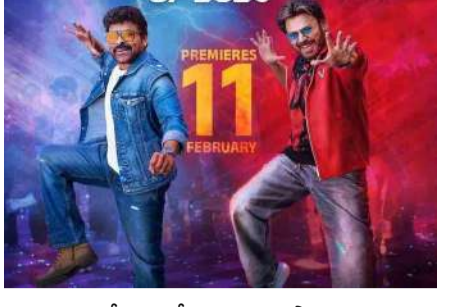
వేద న్యూస్ డెస్క్:

మెగాస్టార్ చిరంజీవి అభిమానులు ఎంతగానో ఎదురుచూస్తున్న ఆ క్షణం రానే వచ్చేసింది. ఈ ఏడాది సంక్రాంతి కానుకగా విడుదలై బాక్సాఫీస్ వద్ద కలెక్షన్ల సూపామ్ సృష్టించిన 'మన శంకర వరప్రసాద్ గారు' చిత్రం ఇప్పుడు డిజిటల్ తెరపై నందడి చేసేందుకు సిద్ధమైంది. ఈ సినిమాకు ప్రముఖ ఓటీటీ సంస్థ జీ5 డిజిటల్ హక్కులను సొంతం చేసుకోగా, ఫిబ్రవరి 11 నుంచి తెలుగుతో పాటు తమిళం, మలయాళం, హిందీ, కన్నడ భాషల్లో స్ట్రీమింగ్ ప్రారంభం కానున్నట్లు చిత్ర బృందం అధికారికంగా ప్రకటించింది. ధియేటర్లలో మిస్ అయినవారికి, మళ్లీ చూడాలనుకునే అభిమానులకు ఇది మంచి అవకాశంగా మారింది. దర్శకుడు అనిల్ రావిపూడి మార్కు ఎంటర్టైన్మెంట్, కామెడీ టైమింగ్, ఫ్యామిలీ ఎమోషన్లతో తెరకెక్కిన ఈ