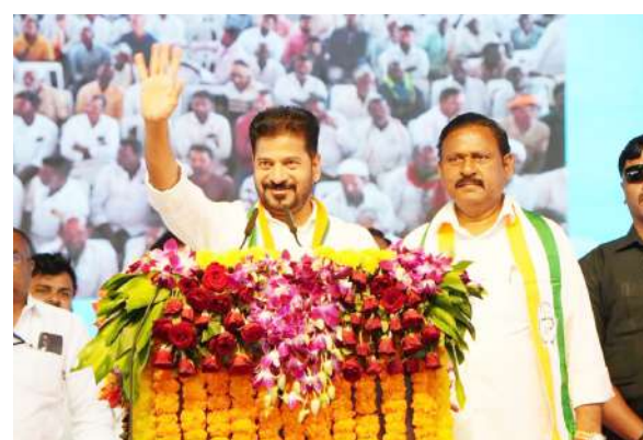
వేద న్యూస్, వికారాబాద్

గోదావరి జలాల ద్వారా తాండూరు, పరిగి, వికారాబాద్ ప్రాంతాలను సస్యశ్యామలం చేస్తామని ముఖ్యమంత్రి ఎ. రేవంత్ రెడ్డి స్పష్టం చేశారు. అలాగే వచ్చే మూడేళ్లలో మక్తల్-నారాయణపేట-కొండంగల్ ఎత్తిపోతల పథకాన్ని పూర్తి చేసి సుమారు లక్షా యాభై వేల ఎకరాలకు సాగునీరు అందిస్తామని తెలిపారు. ప్రజా పాలన-ప్రగతి బాట కార్యక్రమంలో భాగంగా వికారాబాద్ జిల్లా నారాయణపూర్ గ్రామంలో నిర్వహించిన బహిరంగ సభలో సీఎం మాట్లాడారు. లక్షిదేవిపల్లిలో రిజర్వాయర్ నిర్మాణానికి సంబంధించి భూసేకరణతో పాటు అవసరమైన