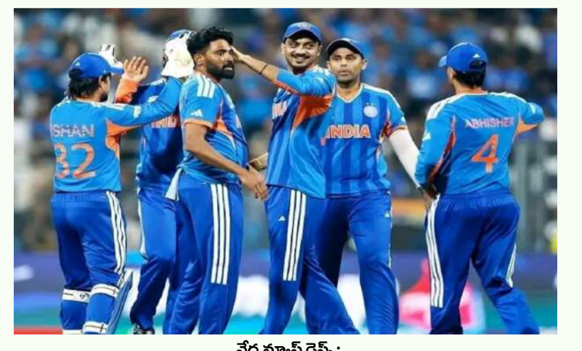
వేద న్యూస్ డెస్క్:

పొట్టి ప్రపంచకప్ లో భారత జట్టు అదిరిపోయే ఆరంభం చేసింది. తొలి లీగ్ మ్యాచ్ లో అమెరికా జట్టును ఎదుర్కొన్న భారత్ బౌలింగ్, బ్యాటింగ్ రెండింటిలోనూ