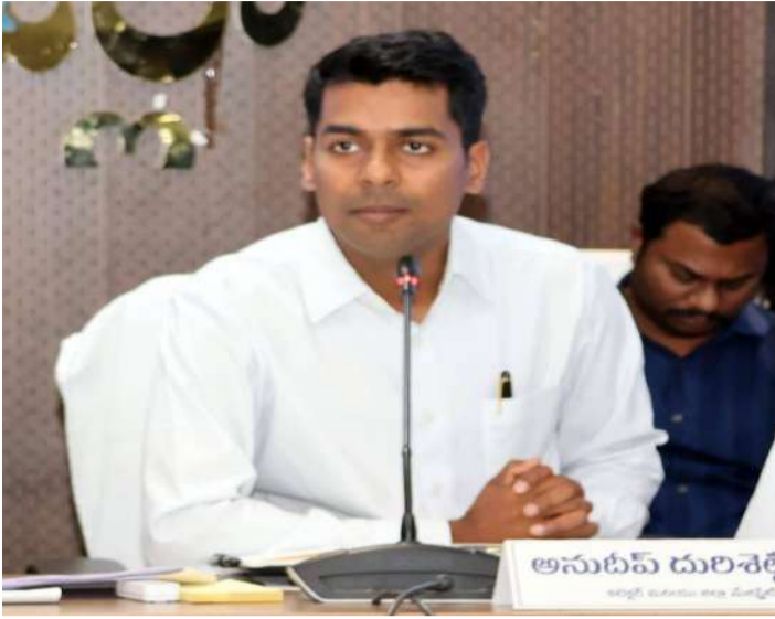
వేద న్యూస్, ఖమ్మం ప్రతినిధి: