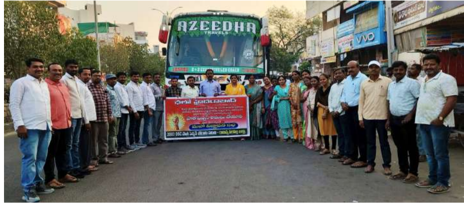
వేద న్యూస్, చంద్రులు: