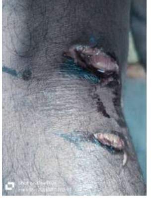
వేద న్యూస్, రుద్రూర్ :

కుక్కలు స్వైర విహారం చేస్తూ ప్రజలను తీవ్ర భయాందోళనకు గురి చేస్తున్నాయి. రుద్రూర్ గ్రామానికి చెందిన ఓ వ్యక్తి శు క్రవారం రాత్రి కుక్క కరవడంతో కాలికి తీవ్ర గాయం అయ్యింది. వెంటనే చికిత్స నిమిత్తం ఆసుపత్రికి తరలించారు. రుద్రూర్ గ్రామంలో వీధి కుక్కలు విచ్చలవిడిగా సంచరిస్తున్న ప్రజలపై దాడికి గురిచేస్తున్నాయి. రాత్రి సమయంలో సైతం రోడ్లపైకి వచ్చి నడుచుకుంటూ వేళ్ల వారిపై వీధి కుక్కలు దాడులకు పాల్పడుతుండడంతో ప్రజలు ఆందోళన చెందుతున్నారు. అధికారులు స్పందించి కుక్కల బెడద నుండి రక్షించాలని గ్రామస్థులు కోరారు.