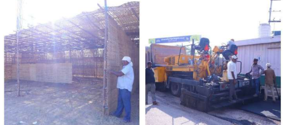
వేద న్యూస్, వేములవాడ ప్రతినిధి:

వేములవాడలోని శ్రీ రాజరాజేశ్వర స్వామి దేవస్థానం అనుబంధ ఆలయమైన భీమేశ్వర స్వామి ఆలయంలో జరగనున్న మహాశివరాత్రి జాతరకు ఘనంగా ఏర్పాట్లు చేపడుతున్నారు. మహాశివరాత్రి సందర్భంగా ఆలయానికి భారీ సంఖ్యలో భక్తులు తరలివచ్చే అవకాశమున్న వేపద్వారాలో ఆలయ అధికారులు విస్తృత స్థాయిలో ఏర్పాట్లు చేస్తున్నారు. ఆలయ పార్కింగ్ ప్రదేశంలో ప్రత్యేకంగా విద్యుత్ దీపాల అలంకరణలు, భారీ గేట్లు ఏర్పాటు చేయడంతో పాటు వాహనాలను సక్రమంగా నిలిపేందుకు ప్రత్యేక పార్కింగ్ సదుపాయం కల్పించారు. అలాగే శివార్లన కార్యక్రమాల కోసం ప్రత్యేక వేదికను (స్టేజీ) ఏర్పాటు చేశారు. భక్తులకు ఎలాంటి అసౌకర్యం కలగకుండా చలవ పందిళ్లు, తాగునీటి సదుపాయం, స్వామి-అమ్మవార్లకు రంగురంగుల విద్యుత్ దీపాల అలంకరణలు ఏర్పాటు చేస్తున్నారు. అదనంగా పారిశుధ్యత చర్యలు చేపట్టడంతో పాటు తాత్కాలిక మరుగుదొడ్లు (ట్రాయిలెట్లు), సీసీ రోడ్ల సదుపాయం వంటి ఏర్పాట్లు పూర్తి చేస్తున్నారు. మహాశివరాత్రి సందర్భంగా వచ్చే భక్తులకు ఎలాంటి ఇబ్బందులు లేకుండా అన్ని విభాగాలతో సమన్వయం చేసుకుంటూ సమగ్ర ఏర్పాట్లు చేస్తున్నామని ఆలయ అధికారులు తెలిపారు.