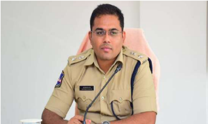
మున్సిపల్ ఎన్నికల ఓట్ల లెక్కింపు సందర్భంగా సిరిసిల్ల, వేములవాడలో ఏర్పాటు చేసిన కౌంటింగ్ కేంద్రాల వద్ద 250 మంది పోలీసులతో కట్టుదిట్టమైన బందోబస్తు ఏర్పాటు చేసినట్లు జిల్లా ఎస్పీ మహేష్ బి. గిత్ తెలిపారు.

మున్సిపల్ ఎన్నికల ఓట్ల లెక్కింపు సందర్భంగా సిరిసిల్ల, వేములవాడలో ఏర్పాటు చేసిన కౌంటింగ్ కేంద్రాల వద్ద 250 మంది పోలీసులతో కట్టుదిట్టమైన బందోబస్తు ఏర్పాటు చేసినట్లు జిల్లా ఎస్పీ మహేష్ బి. గిత్ తెలిపారు. లెక్కింపు సమయంలో ఎలాంటి అవాంఛనీయ సంఘటనలు చోటు చేసుకోకుండా సెక్షన్ 163 బీఎన్ఎస్ఎస్ (సెక్షన్ 144) అమలు చేస్తున్నామని పేర్కొన్నారు. ఎన్నికల ఫలితాలు ప్రకటించే వరకు మోడల్ కోడ్ ఆఫ్ కండక్ట్ అమలులో ఉంటుందని తెలిపారు. విజయోత్సవ ర్యాలీలు, బైక్ ర్యాలీలు, సభలు, డీజే కార్యక్రమాలు, టపాకారులు కాల్యం, గుంపులుగా గుమికూడడం పూర్తిగా నిషేధించామని స్పష్టం చేశారు. ఎన్నికల నియమాలను అతిక్రమించిన వారిపై చట్టపరమైన చర్యలు తీసుకుంటామని ఎస్పీ హెచ్చరించారు.