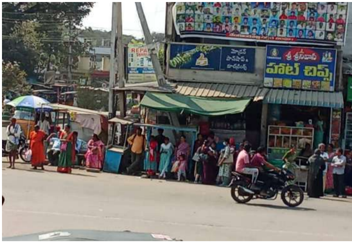
- బోయినపల్లిలో కార్మికుల డిమాండ్

ఖమ్మం జిల్లా నేలకొండపల్లి మండలం చారిత్రక ప్రాధాన్యం కలిగిన ప్రాంతంగా గుర్తింపు పొందింది. భక్త రామదాసు జన్మస్థలంగా ప్రసిద్ధి చెందిన ఈ ప్రాంతంలో, దక్షిణ భారతదేశంలో రెండో అతిపెద్ద బౌద్ధ స్తూపం కూడా ఉంది. అయితే ఇంతటి చారిత్రక ప్రాధాన్యం ఉన్న నేలకొండపల్లి మండల కేంద్రంలో ఇప్పటికీ బస్టాండ్ లేకపోవడం ప్రజలను తీవ్ర ఇబ్బందులకు గురిచేస్తోంది. ప్రస్తుతం ఖమ్మం, కోదాడ తదితర ప్రాంతాలకు వెళ్లే వందలాది మంది ప్రయాణికులు ప్రతిరోజూ రోడ్లపైనే నిలబడి బస్సుల కోసం ఎదురుచూడాల్సి వస్తోంది. ఎండ, వానలను లెక్కచేయకుండా రోడ్లపై నిలబడే