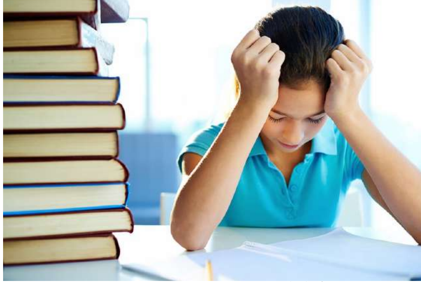
పిల్లల్లో అభివృద్ధి భావం

నేటి ఆధునిక విద్యా వ్యవస్థ కేవలం మార్కులు, ర్యాంకుల చుట్టూ తిరుగుతున్న ఒక వ్యాపార చక్రంలా మారిపోయింది. విద్య అనేది జ్ఞానాన్ని పంచి, విజ్ఞతను పెంచాల్సింది పోయి.. కేవలం పోటీ ప్రపంచంలో ఒక పరుగు పందెంలా తయారైంది. కార్పొరేట్ విద్యా సంస్థల మద్దతు నెలకొన్న అనారోగ్యకరమైన పోటీలో విద్యార్థులు కేవలం నెంబర్లుగా మిగిలిపోతున్నారు. ఉదయం 6 గంటల నుంచి రాత్రి 10 గంటల వరకు విరామం లేని క్లాసులు, నిరంతర పరీక్షలు, ర్యాంకుల వేటలో పిల్లలు తమ బాల్యాన్ని, సృజనాత్మకతను పూర్తిగా కోల్పోతున్నారు. చదువు అంటే పుస్తకాల్లోని విషయాన్ని బట్టి పట్టడం అనే స్థాయికి పడిపోవడం వల్ల, విద్యార్థుల్లో ఆలోచనా శక్తి నశించి వారు కేవలం పరీక్షలు రాసే యంత్రాలుగా మారుతున్నారు.