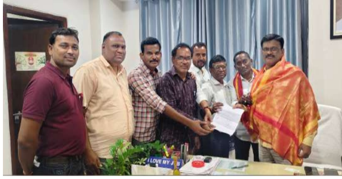
వేద న్యూస్, మెట్పల్లి ప్రతినిధి:

మెట్పల్లి డివిజన్ తెలుగు ఘోరం అధ్యక్షులలో మెట్పల్లి, ఇబ్రహీంపట్నం, మల్లాపూర్ మండలాలకు చెందిన విద్యార్థుల కోసం తెలుగు ప్రతిభ పరీక్ష - 2026 నిర్వహించనున్నట్లు నిర్వాహకులు తెలిపారు. తెలుగు భాషపై విద్యార్థుల ఆసక్తి పెంపొందించడం, వారి భాషా నైపుణ్యాలను వెలికితీయడం లక్ష్యంగా ఈ పరీక్షను నిర్వహిస్తున్నట్లు పేర్కొన్నారు. ఈ పరీక్ష మార్చి 17వ తేదీ ఉదయం 10:30 నుంచి 11:30 గంటల వరకు మెట్పల్లి ప్రభుత్వ జూనియర్ కళాశాల (జిజీసీ)లో జరగనుంది. పరీక్షను జూనియర్, సీనియర్ విభాగాలుగా నిర్వహించనున్నారు. జూనియర్ విభాగంలో 6, 7 తరగతుల విద్యార్థులు, సీనియర్ విభాగంలో 8, 9 తరగతుల విద్యార్థులు పాల్గొనవచ్చు. ప్రతి పాఠశాల నుంచి ఒక్కో విభాగంలో ఒక విద్యార్థిని ఎంపిక చేసి పంపించాల్సి ఉంటుంది. సిలబస్లో కవి పరిచయాల, పదజాలం, భాషా