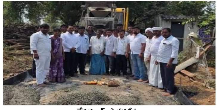
వేద న్యూస్, పాపన్నపేట :