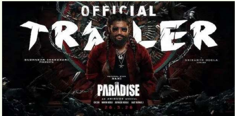
వేద న్యూస్ డెస్క్:

టాలీవుడ్ నేచురల్ స్టార్ నాని, దర్శకుడు శ్రీకాంత్ ఓదెల కాంబినేషన్లో తెరకెక్కుతున్న 'ది ప్యారడైజ్' సినిమాపై ప్రేక్షకుల్లో భారీ ఆసక్తి నెలకొంది. 'దసరా' తర్వాత ఈ జంట నుంచి వస్తున్న రెండో సినిమా కావడంతో అంచనాలు మరింత పెరిగాయి. చిత్ర బృందం తాజాగా ఇచ్చిన సమాచారం ప్రకారం, ఈ సినిమాలోని పరిచయ గీతం 'ఆయా పేర్'ను ఫిబ్రవరి 24న విడుదల చేయనున్నారు. ఈ గీతానికి సంగీతాన్ని అనిరుద్ధ రవిచందర్ అందించగా, సుధన్ మాస్టర్ సృష్ట్య దర్శకత్వంలో భారీ సెట్స్లో చిత్రీకరించారు. వందలాది మంది కళాకారులతో రూపొందించిన ఈ గీతం తెరపై ప్రత్యేక ఆకర్షణగా నిలుస్తుందని అభిమానులు భావిస్తున్నారు. విడుదలకు ముందే ఈ గీతంపై మంచి ఆసక్తి ఏర్పడింది. సామాజిక నేపథ్యంతో తెరకెక్కుతున్న ఈ సినిమాలో వెనుకబడిన గిరిజన వర్గాల సమస్యలపై పోరాడే నాయకుడిగా నాని శక్తివంతమైన పాత్రలో కనిపించనున్నారు. ఈ చిత్రంలో కాయూరు లోహర్ కథానాయికగా నటిస్తుండగా, మోహన్ బాబు, రాహుల్ జుయల్, సంపూర్ణ బాబు కీలక పాత్రల్లో కనిపించనున్నారు. తొలుత మార్చి 26న విడుదల చేయాలని భావించిన చిత్రాన్ని, నాణ్యత కోసం ఆగస్టు 21కు వాయిదా వేసినట్లు చిత్ర వర్గాలు తెలిపాయి. పండుగల సీజన్లో విడుదల కావడం చిత్రానికి కలిసిస్తుందని నిర్మాతలు ఆశాభావం వ్యక్తం చేస్తున్నారు.