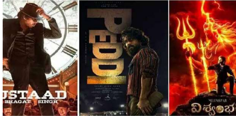
వేద న్యూస్ డెస్క్:

తెలుగు చలనచిత్ర పరిశ్రమ ఇటీవల వరుస విజయాలతో దూసుకెళ్తోంది. సంక్రాంతి కాసుకగా విడుదలైన 'శంకర వరప్రసాద్' చిత్రం నాలుగు వందల కోట్లకు పైగా వసూళ్లు సాధించి టాలీవుడ్ శక్తిని మరోసారి చాటిచెప్పింది. ఇదే ఉత్సాహాన్ని కొనసాగిస్తూ ఈ వేసవి కాలంలో కూడా భారీ చిత్రాలు ప్రేక్షకుల ముందుకు రాబోతున్నాయి. ముఖ్యంగా మెగా హీరోల సినిమాలు బాక్సాఫీస్ వద్ద హాట్ టాపిక్ గా మారాయి. వేసవి రేసులో మెగా అభిమానులు ఎంతో ఆసక్తిగా ఎదురుచూస్తున్న చిత్రం 'ఉస్సాద్ భగత్ సింగ్'. ఇందులో పవన్ కళ్యాణ్ ప్రధాన పాత్రలో నటిస్తున్నారు. మాన్ వినోదంగా రూపొందుతున్న ఈ చిత్రం మార్చి 26న విడుదలకు సిద్ధమవుతోంది. మరోవైపు మెగాస్టార్ చిరంజీవి నటిస్తున్న సోషియో ఫాంటసీ చిత్రం 'విశ్వంధర' మే నెలలో ప్రేక్షకుల ముందుకు రానుంది. ఈ రెండు చిత్రాలపై అభిమానుల్లో భారీ అంచనాలు నెలకొన్నాయి. వీటితో పాటు ఏప్రిల్ 30న 'పెద్ది' చిత్రం కూడా విడుదలకు సిద్ధమవుతోంది. అంతేకాకుండా దేశవ్యాప్తంగా గుర్తింపు పొందిన 'టాక్సిక్', 'ధురంధర్ 2', 'దెకాయట్' వంటి చిత్రాలు కూడా వేసవి బరిలో నిలవనున్నాయి. అయితే ప్రధానంగా మెగా హీరోల చిత్రాలపైనే అందరి దృష్టి కేంద్రీకృతమైంది. ఈ వేసవిలో ఏ చిత్రం అతిపెద్ద విజయాన్ని సాధించి కొత్త రికార్డులు సృష్టిస్తుందో చూడాలి.