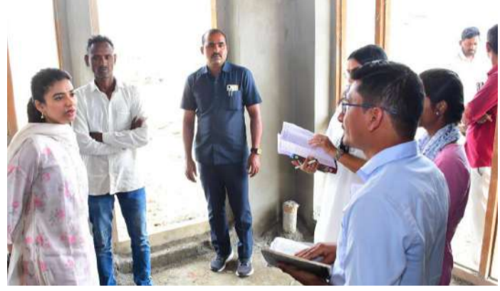
వేద న్యూస్, కోనరావుపేట

రాజన్న సిరిసిల్ల జిల్లా కోనరావుపేట మండలం మర్రిమద్ద, నిమ్మపల్లి గ్రామాల్లో జరుగుతున్న ఇందిరమ్మ ఇండ్ల నిర్మాణాలను ఇంచార్జి కలెక్టర్