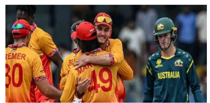
వేద న్యూస్ డెస్క్:

పురుషుల ఇరవై ఓవర్ ప్రపంచకప్లో సూపర్ 8 దశపై ఆశలు పెట్టుకున్న ఆస్ట్రేలియా జట్టుకు వర్షం పెద్ద షాక్ ఇచ్చింది. పల్లెకెలె మైదానంలో జరగాల్సిన ఐర్లాండ్ జింబాబ్వే మ్యాచ్ కుండపోత వర్షం కారణంగా రద్దు కావడంతో సమీకరణాలు పూర్తిగా మారిపోయాయి. ఈ ఫలితంతో జింబాబ్వే జట్టు ఐదు పాయింట్లతో తదుపరి దశకు అర్హత సాధించగా, మాజీ విజేత ఆస్ట్రేలియా టోర్నీ నుంచి నిష్క్రమించింది. మ్యాచ్ ప్రారంభం కాకముందే వర్షం ఆగకపోవడంతో టాస్ కూడా వేరుకుండా అంపైర్లు ఆటను రద్దు చేశారు. ఇరుజట్టుకు చెరో పాయింట్ కేటాయింపడంతో జింబాబ్వే పాయింట్ల పట్టికలో ముందంజ వేసింది. ఇదే ఆస్ట్రేలియా అవకాశాలను పూర్తిగా దెబ్బతీసింది. గత మ్యాచ్లలో వచ్చిన ఓటములు కూడా కంగారూ జట్టుకు భారంగా మారాయి.