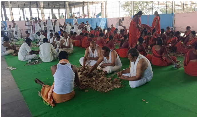
కార్యక్రమంలో ఆలయ సిబ్బంది, అన్నమాచార్య సేవా ట్రస్ట్ సభ్యులు పాల్గొనగా, పాపన్నపేట పోలీసులు బందోబస్తు నిర్వహించారు.