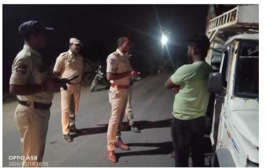
వేద న్యూస్, బోయినిపల్లి:

రాజన్న సిరిసిల్ల జిల్లా బోయినిపల్లి మండల కేంద్రంలో పోలీసులు బుధవారం సాయంత్రం డ్రంక్ అండ్ డ్రైవ్పై ప్రత్యేక డ్రైవ్ నిర్వహించారు. ఎన్ఐఐ రమాకాంత్ ఆధ్వర్యంలో చేపట్టిన ఈ తనిఖీలో వాహనదారుల డ్రువల్యాలను పరిశీలించి, ట్రాఫిక్ నిబంధనలపై అవగాహన కల్పించారు.