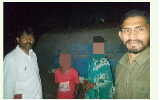
వేద న్యూస్, వేములవాడ: