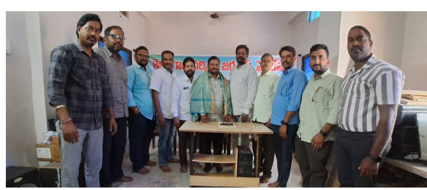
వేద న్యూస్, మంచినాటి:

తెలంగాణ వర్సింగ్ జర్నలిస్టు ఫెడరేషన్ (టీడబ్ల్యుజేఎఫ్) యూనియన్