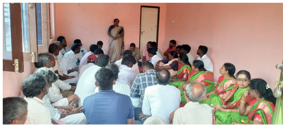
వేద న్యూస్, పాపన్నపేట: