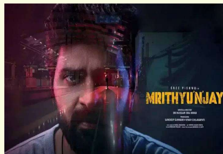
వేద న్యూస్ డెస్క్: