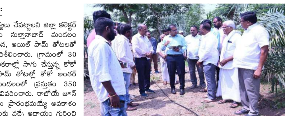
పరిశీలించారు. లబ్ధిదారులకు ప్రభుత్వం నిధులు రెగ్యులర్ గా విడుదల చేస్తున్నదని తెలిపారు. బొంతకుంటపల్లి గ్రామానికి చెందిన ఒక లబ్ధిదారుకు ఇప్పటికే రూ.3.40 లక్షలు విడుదలయ్యాయని, పనులు పూర్తి చేస్తే మిగిలిన నిధులు విడుదల అవుతాయని చెప్పారు. పెండింగ్ పనులను 15 రోజుల్లో పూర్తి చేసి ఫైనల్ బిల్లు సమర్పించాలని కలెక్టర్ సూచించారు. ఈ చర్యలలో హాక్విలర్ అధికారులు, ఎంపీడీవో, ఇతర శాఖల అధికారులు పాల్గొన్నారు. రైతులకు మేలు చేసే విధంగా పథకాలు అమలు చేయాలని కలెక్టర్ కోయ శ్రీ హర్ష పేర్కొన్నారు.

జిల్లాలో ఆయిల్ పామ్ పంట విస్తరణకు చర్యలు చేపట్టాలని జిల్లా కలెక్టర్ కోయ శ్రీ హర్ష సూచించారు. బుధవారం సుల్తానాబాద్ మండలం బొంతకుంటపల్లి గ్రామంలో పర్యటించిన ఆయన, ఆయిల్ పామ్ తోటలతో పాటు ఇందిరమ్మ ఇండ్ల నిర్మాణ పనులను పరిశీలించారు. గ్రామంలో 30 ఎకరాల్లో సాగు చేస్తున్న ఆయిల్ పామ్, 4 ఎకరాల్లో సాగు చేస్తున్న కోకో పంటలను కలెక్టర్ పరిశీలించారు. ఆయిల్ పామ్ తోటల్లో కోకో అంతర్ పంటగా సాగు చేయవచ్చని తెలిపారు. మండలంలో ప్రస్తుతం 350 ఎకరాల్లో ఆయిల్ పామ్ సాగు జరుగుతోందని వివరించారు. రాజ్ కోయ జూన్ నుంచి కొన్ని ప్రాంతాల్లో ఆయిల్ పామ్ కోతలు ప్రారంభమయ్యే అవకాశం ఉందని కలెక్టర్ తెలిపారు. పంట ద్వారా రైతులకు వచ్చే ఆదాయం గురించి విస్తృతంగా ప్రచారం చేసి మరింత విస్తరణకు చర్యలు తీసుకోవాలని సూచించారు. నేగా పథకం కింద గడ్డి తొలగించు పనులు చేపడితే రైతులకు ఉపయోగకరంగా ఉంటుందని రైతులు తెలియజేయగా, దీనిపై పరిశీలించాలని అధికారులకు సూచించారు. అధికారులు, కంపెనీ ప్రతి నిధుల ద్వారా రైతులకు అవసరమైన సాంకేతిక సూచనలు అందుతున్నాయని తెలియ తెలిపారు. పంట పురోగతిపై కలెక్టర్ సంతృప్తి వ్యక్తం చేశారు. ఆయిల్ పామ్ సాగు ద్వారా రైతుల ఆదాయం పెరగడం సాధ్యమని పేర్కొన్నారు. ఇందిరమ్మ ఇండ్ల నిర్మాణ పనుల పురోగతిని కూడా కలెక్టర్