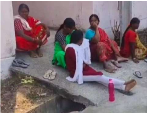
వేద న్యూస్, జమ్మికుంట:

- డబుల్ బెడ్రూమ్ ఇళ్ల కేటాయింపుపై బాధితుల ఆవేదన