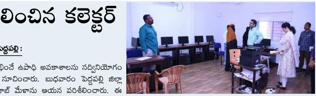
నిరుద్యోగ యువత జాబ్ మేళాల ద్వారా లభించే ఉపాధి అవకాశాలను సద్వినియోగం చేసుకోవాలని జిల్లా కలెక్టర్ కోయ శ్రీ హర్ష సూచించారు. బుధవారం పెద్దపల్లి జిల్లా కేంద్రంలోని టాస్కో సెంటర్ లో నిర్వహిస్తున్న జాబ్ మేళాను ఆయన పరిశీలించారు. ఈ సందర్భంగా కలెక్టర్ మాట్లాడుతూ నిరుద్యోగ యువతకు ఉపాధి అవకాశాలు కల్పించేందుకు జిల్లా యంత్రాంగం పలు చర్యలు చేపడుతున్నట్లు తెలిపారు. టాస్కో సెంటర్ ద్వారా వివిధ నైపుణ్య కోర్సుల్లో శిక్షణ అందిస్తూ, మంచి కంపెనీలలో ఉద్యోగ అవకాశాలు కల్పించేలా ప్రయత్నాలు చేస్తున్నామని చెప్పారు. టాస్కో సెంటర్ లో సమయ ప్రతి నిరుద్యోగికి ఉపాధి లభించేలా చర్యలు తీసుకుంటున్నామని కలెక్టర్ పేర్కొన్నారు. జాబ్ మేళా కార్యక్రమాలను నిరంతరం నిర్వహిస్తూ యువతకు మరిన్ని అవకాశాలు కల్పిస్తున్నామని తెలిపారు. నేడు వివిధ కంపెనీల ద్వారా నిరుద్యోగులకు జాబ్ మేళాలో ఎంపికైన ఆర్థులకు శిక్షణతో పాటు ఉద్యోగాలు కూడా కల్పించనున్నట్లు ఆయన వివరించారు. ఈ తరహా కార్యక్రమాలను యువత తప్పక వినియోగించుకోవాలని సూచించారు. ఈ కార్యక్రమంలో టాస్కో సెంటర్ అధికారులు, కౌన్సిల్ సిబ్బంది మరియు ఇతర సంబంధిత అధికారులు పాల్గొన్నారు. యువత భవిష్యత్తు కోసం ప్రభుత్వం చేపడుతున్న కార్యక్రమాలను ఉపయోగించుకోవాలని కలెక్టర్ కోయ శ్రీ హర్ష పిలుపునిచ్చారు.