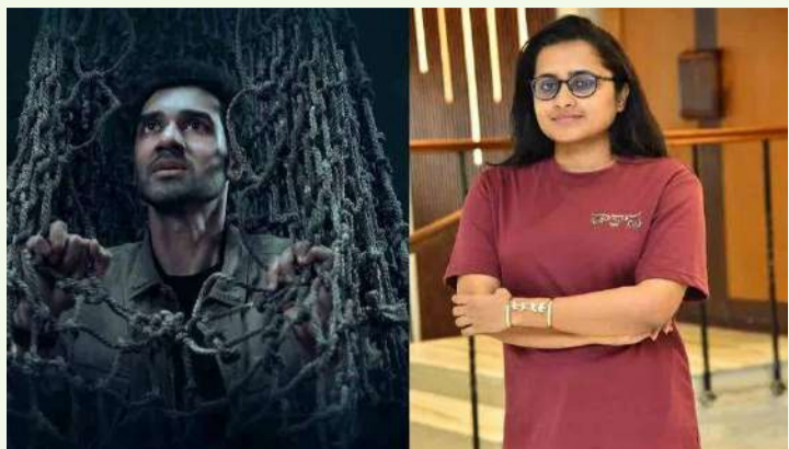
వేద న్యూస్ డెస్క్: