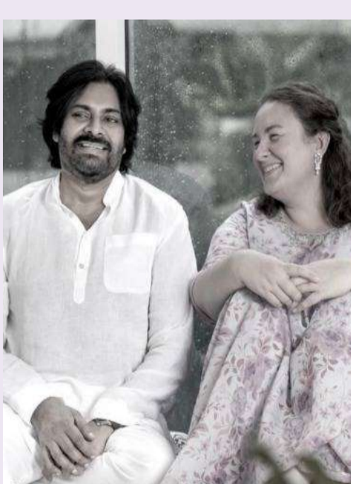
వేద న్యూస్ డెస్క్:

పవర్ స్టార్ పవన్ కళ్యాణ్ సతీమణి అన్నా రెజినోవా సోషల్ మీడియాలోకి అడుగుపెట్టి 'అన్నా కొణిదెల' గా కొత్త ప్రయాణాన్ని ప్రారంభించడం అభిమానుల్లో ఆసక్తిని రేకెత్తిస్తోంది. ఇన్ స్టాగ్రామ్ వేదికగా ఆమె ఖాతా ప్రారంభించగానే భారీ స్పందన లభించగా, కొద్ది గంటల్లోనే లక్షల సంఖ్యలో అనుచరులు చేరడం విశేషం. తొలి పోస్టులో తనను పరిచయం చేసుకున్న అన్నా కొణిదెల, రెండో పోస్టులో భర్త పవన్ కళ్యాణ్ తో కలిసి ఉన్న ఫోటోను పంచుకోవడం అభిమానులను ఆకట్టుకుంది. తన బయోలో "రవ్వన్ హాట్, ఇండియన్ సోల్" అని పేర్కొంటూ తన వ్యక్తిత్వాన్ని ప్రతిబింబించారు. రష్యాలో జన్మించి, భారతీయ కుటుంబంలో కోడలిగా చేరిన తర్వాత రెండు సంస్కృతుల సమ్మేళనంతో జీవిస్తున్నారని ఆమె వెల్లడించారు. ఇన్ స్టాగ్రామ్ లోకి రావాలన్న ఆలోచన చాలా కాలంగా ఉన్నప్పటికీ, ఇప్పుడు సరైన సమయం అనిపించిందని ఆమె తెలిపారు. కుటుంబ సభ్యుల ఆశీస్సులు, ముఖ్యంగా భర్త పవన్ కళ్యాణ్ ప్రోత్సాహంతో ఈ కొత్త ప్రయాణాన్ని ప్రారంభిస్తున్నారని పేర్కొన్నారు. ప్రేమ, కృతజ్ఞతలతో జీవిస్తూ నిరంతరం నేర్చుకోవడం తన జీవిత విధానమని ఆమె తన పోస్టుల్లో తెలియజేశారు. ఇదిలా ఉండగా, అన్నా కొణిదెల సోషల్ మీడియాలోకి రావడాన్ని పవన్ కళ్యాణ్ స్వాగతించి ప్రత్యేక సందేశం పంచుకున్నారు. మొత్తానికి, అన్నా కొణిదెల ఇన్ స్టాగ్రామ్ ఎంట్రీతో మెగా అభిమానులకు ఆమె మరింత దగ్గరయ్యే అవకాశం కనిపిస్తోంది. రాబోయే రోజుల్లో ఆమె మరిన్ని ఆసక్తికరమైన విషయాలను పంచుకుంటూ సోషల్ మీడియాలో ప్రత్యేక గుర్తింపు సాధించే అవకాశం ఉందని విశ్లేషకులు భావిస్తున్నారు.