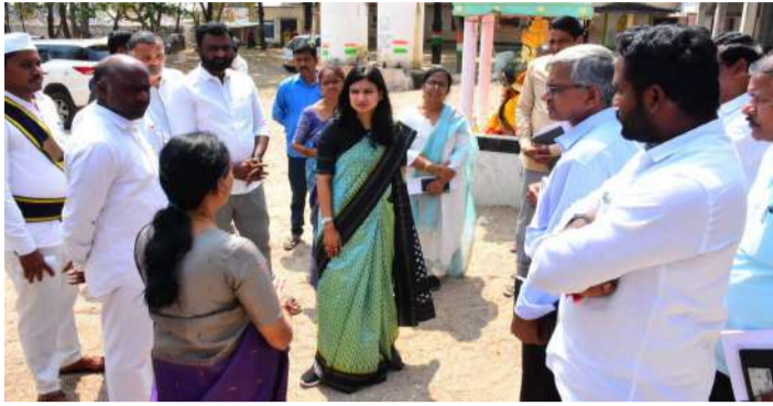
వేద న్యూస్, ఎలర్నెడ్జిపేట:

పీఎంఐ పథకం కింద ఎలర్నెడ్జిపేట మండలం బొప్పాపూర్ గ్రామంలోని జిడ్పీ హైస్కూల్లో నిర్మిస్తున్న అదనపు తరగతి గదులు, సైన్స్ ల్యాబ్ పనులను వేగవంతంగా పూర్తి చేయాలని జిల్లా కలెక్టర్ గరిమ అగ్రవాలే ఆదేశించారు. గురువారం పాఠశాలను సందర్శించిన ఆమె నిర్మాణ పనులను పరిశీలించి, అధికారులు మరియు కాంట్రాక్టర్లకు పలు సూచనలు చేశారు. రానున్న 20 రోజుల్లో పనులు పూర్తిచేసి వినియోగంలోకి తీసుకురావాలని ఆదేశించారు. పాఠశాలలో విద్యార్థుల సంఖ్య, అందుబాటులో ఉన్న తరగతి గదుల వివరాలను అధికారులను అడిగి తెలుసుకున్నారు. అనంతరం పదో తరగతి