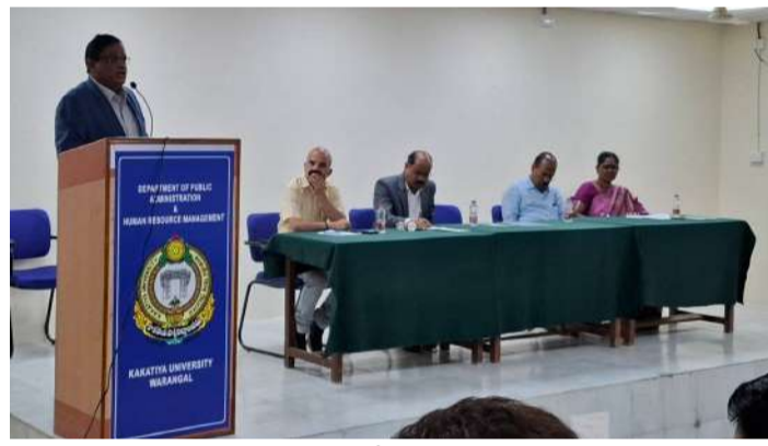
వేద న్యూస్, కేయా క్యాంపస్:

ఉన్నత విద్యలో నైపుణ్యాభివృద్ధి, నాణ్యత పెంపు లక్ష్యంగా విశ్వవిద్యాలయ పరిధిలోని ప్రభుత్వ డిగ్రీ, పాలిటెక్నిక్ కళాశాలలకు మెంటరింగ్ అందించేందుకు కాకతీయ విశ్వవిద్యాలయం సిద్ధంగా ఉందని వైస్ ఛాన్సలర్