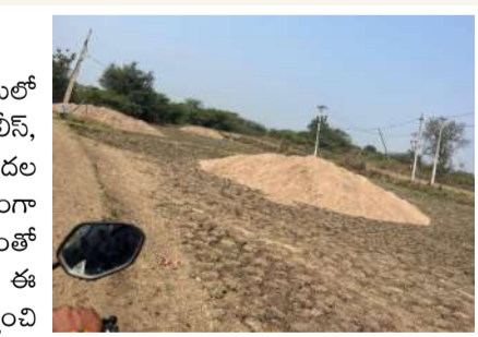
వేద న్యూస్, పాపన్నపేట:

మండల కేంద్రంలోని గాజులగూడెం గ్రామ శివారులో అక్రమంగా నిల్వ ఉంచిన ఇసుక కుప్పలను పోలీస్, రెవెన్యూ సంయుక్త బృందం సీజ్ చేసింది. గాడిదల ద్వారా ఇసుకను తరలించి అర్ధరాత్రి వేళల్లో అక్రమంగా అమ్మకాలు జరుగుతున్నట్లు సమాచారం అందడంతో అధికారులు ఆకస్మిక దాడులు నిర్వహించారు. ఈ సందర్భంగా సుమారు 30 ఇసుక కుప్పలను గుర్తించి స్వాధీనం చేసుకున్నట్లు తెలిపారు. అక్రమ ఇసుక రవాణా, నిల్వలపై కఠిన చర్యలు కొనసాగుతాయని పోలీస్, రెవెన్యూ అధికారులు హెచ్చరించారు.