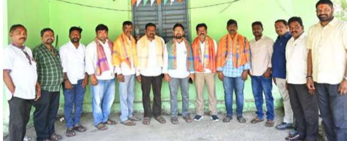
వేద న్యూస్, శాయంపేట: