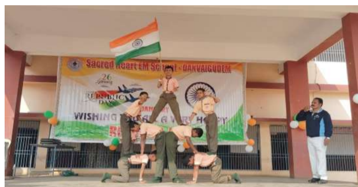
వేద న్యూస్, ఖమ్మం ప్రతినిధి: