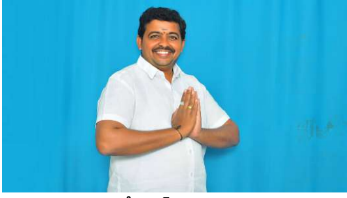
వేద న్యూస్, జమ్మికుంట: