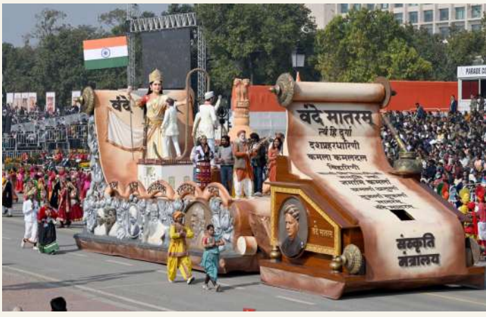
ముదటి పేజీ తరువాయి

గణతంత్ర వేడుకల ద్వారా భారతదేశ ప్రజాస్వామ్య బలం, సాంస్కృతిక వారసత్వ సంపద, దేశాన్ని ఏకతాటిపై నిలిపే ఐక్యత స్పష్టంగా ప్రదర్శితమయ్యాయిని పేర్కొన్నారు. దేశం 77వ గణతంత్ర దినోత్సవాన్ని అత్యంత ఉత్సాహంతో, గర్వంతో జరుపుకుందని ప్రధాని తెలిపారు. గణతంత్ర దినోత్సవ పరేడ్ భారతదేశ అత్యుత్తమైన భద్రతా వ్యవస్థను ప్రతిబింబించింది, దేశ సంసిద్ధత, సాంకేతిక సామర్థ్యం, పౌరాలను రక్షించడంలో ఉన్న అచంచల నిబద్ధతకు ఇది నిదర్శనమని మరోసారి వివరించారు. మన భద్రతా దళాలు అయిన కొనియాడారు. పరేడ్ ప్రారంభానికి ముందు ప్రధాని మోదీ జాతీయ యుద్ధ స్మారకాన్ని సందర్శించి దేశ రక్షణ కోసం ప్రాణాలర్పించిన అమర వీరులకు నివాళులర్పించారు. రాజనీలనీ సంప్రదాయ తలపాగా, నెమలి ఈకల అలంకరణతో మోదీ తన ప్రత్యేక వస్త్రధారణతో మరోసారి అందరి దృష్టిని ఆకర్షించారు.