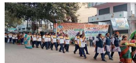
వేద న్యూస్, బోయినపల్లి: