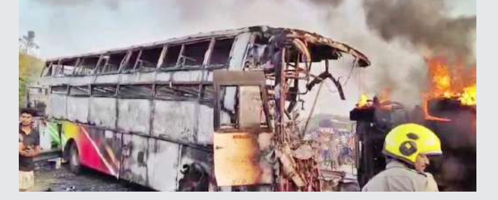
వేద న్యూస్, మార్కాపురం

ఆంధ్రప్రదేశ్ లోని ప్రకాశం జిల్లా మార్కాపురంలోని రాయవరం సమీపంలో ఈరోజు తెల్లవారుజామున ఘోర రోడ్డు ప్రమాదం చోటుచేసుకుని రాష్ట్రవ్యాప్తంగా వివాదాన్ని మిగిల్చింది. ప్రైవేట్ బస్సు, టిప్పర్ లారీ ఢీకొన్న ఈ ఘటనలో 10 మంది ప్రయాణికులు సజీవ దహనమయ్యారు. పలువురు తీవ్రంగా గాయపడటంతో పరిస్థితి ఆందోళనకరంగా మారింది. హైదరాబాద్ నుంచి పామూరుకు సుమారు 40 మంది ప్రయాణికులతో బయలుదేరిన ప్రైవేట్ బస్సు మార్కాపురం, రాయవరం సమీపంలోని క్వారీల వద్దకు రాగానే ఎదురుగా వస్తున్న టిప్పర్ లారీని బలంగా ఢీకొట్టింది. ఢీకొన్న ప్రభావం తీవ్రంగా ఉండటంతో బస్సు పూర్తిగా దెబ్బతింది. ప్రమాదం తర్వాత బస్సు డ్రైవర్ ట్యాంక్ పగిలిపోవడంతో ఒక్క సారిగా మంటలు చెలరేగాయి. వేగంగా వ్యాపించిన మంటలు క్షణాల్లోనే బస్సు, టిప్పర్ ను చుట్టూముట్టాయి. మంటల తీవ్రత ఎక్కువగా ఉండటంతో ప్రయాణికులు బయటకు రావడానికి అవకాశం లేకుండా