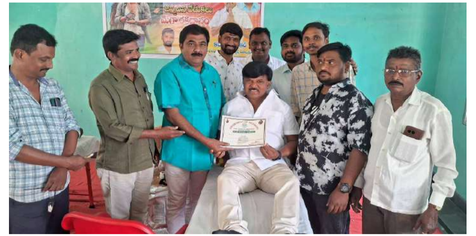
వేద న్యూస్, వరంగల్ టౌన్: