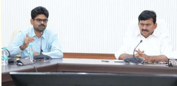
వేద న్యూస్, హైదరాబాద్ ప్రతినిధి