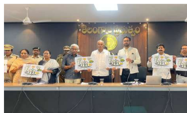
వేద న్యూస్, ఖమ్మం ప్రతినిధి: