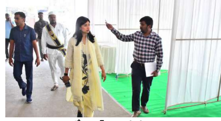
వేద న్యూస్, రాజన్న నిలిసిల్లు:

మున్సిపల్ కార్యాలయాల్లో నామినేషన్ల స్వీకరణ ప్రక్రియను సజావుగా నిర్వహించేందుకు అవసరమైన అన్ని ఏర్పాట్లు ముందుగానే పూర్తి చేయాలని ఇంచార్జి కలెక్టర్ గరిమ అగ్రవాలే అధికారులను ఆదేశించారు. మంగళవారం