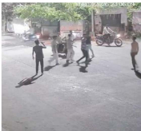
మిల్స్ కాలనీ పోలీస్ స్టేషన్ పరిధిలో ఈ నెల 14వ తేదీన ద్విచక్ర వాహనంపై వెళ్తున్న వ్యక్తులను బీర్ సీసాలతో విచక్షణా రహితంగా దాడి చేస్తున్న యువకులు