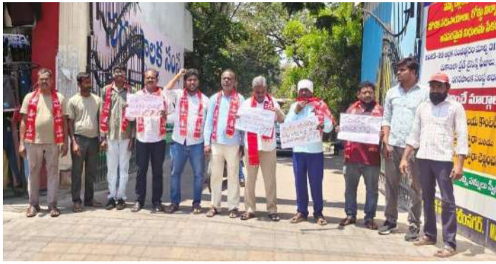
వేద న్యూస్, కరీంనగర్: