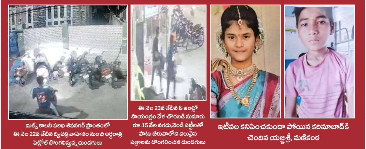
మిల్స్ కాలనీ పరిధి శివభగం ప్రాంతంలో ఈ నెల 22వ తేదీన ద్వితీయ వాహనం నుంచి అర్ధరాత్రి పెట్టోల దొంగనిస్తున్న దుండగులు

వీటన్నింటికీ మూల కారణం గల్లీ గల్లీలో వెలిసిన బెల్ట్ షాపులే అని స్థానికులు ఆరోపిస్తున్నారు. మిల్స్ కాలనీ పరిధిలో అనుమతి లేని బెల్ట్ షాపులు విచ్చలవిడిగా కొనసాగుతున్నాయి. తెల్లవారుజాము నుంచే మధ్యం విక్రయాలు సాగుతున్నా ఎక్కెడో లేదా లోకల్ పోలీసులు కన్నెత్తి చూడటం లేదనే విమర్శలు వెల్లువెత్తుతున్నాయి. మధ్యం మత్తులోనే యువకులు గొడవలకు దిగడం, అసాంఘిక కార్యకలాపాలకు పాల్పడటం జరుగుతోంది. తక్షణమే ఈ బెల్ట్ షాపులపై ఉక్కుపాదం