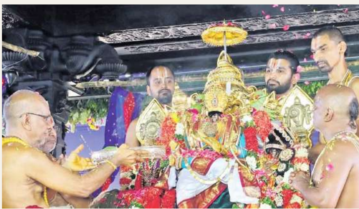
వేద న్యూస్, భద్రాచలం

దక్షిణ అయోధ్యగా విరాజిల్లుతున్న భద్రాచలం పుణ్యక్షేత్రం ఆధ్యాత్మిక శోభతో పరవశించిపోయింది. శుక్రవారం జరిగిన జగదభిరాముడి కల్యాణ మహోత్సవం తర్వాత, శనివారం అత్యంత వైభవంగా శ్రీరామ పట్టాభిషేక పర్వపుట్టం కనువిందు చేసింది. వేద మంత్రోచ్ఛరణలు, మంగళ వాయిద్యాల నడుమ కల్యాణ రాముడు పట్టాభిరాముడిగా దర్శనమివ్వడంతో భక్తజనం పులకించిపోయారు. ఈ అద్భుత ఘట్టానికి తెలంగాణ రాష్ట్ర గవర్నర్ శివ ప్రతాప్ శుక్ల హాజరై స్వామివారికి పట్టువస్త్రాలు సమర్పించగా, మంత్రులు, ప్రజాప్రతినిధులు మరియు వేలాదిమంది భక్తులు స్వామివారి దివ్య రూపానికి నీరాజనాలు పలికారు. రాజదండం, రాజముద్రక, స్వర్ణ కిరీట ధారియై భద్రాద్రి రామయ్య రాజాధిరాజుగా కొలువదీరిన ఆ మహిమాన్విత వేడుక భక్తులను కనువిందు చేసింది