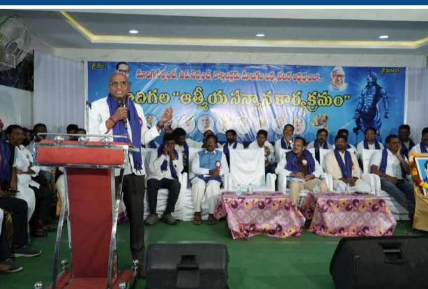
వేద న్యూస్, వరంగల్:

- ఐక్య వేదిక జిల్లా కమిటీ ఆధ్వర్యంలో సన్మాన కార్యక్రమం