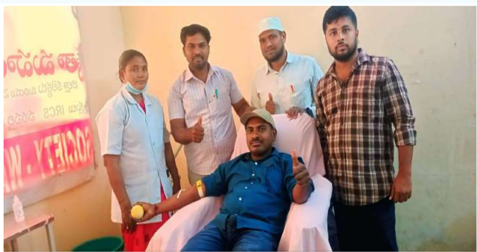
వేద న్యూస్, వరంగల్:

- మానవత్వంతో స్పందించిన యువశక్తి ఫౌండేషన్