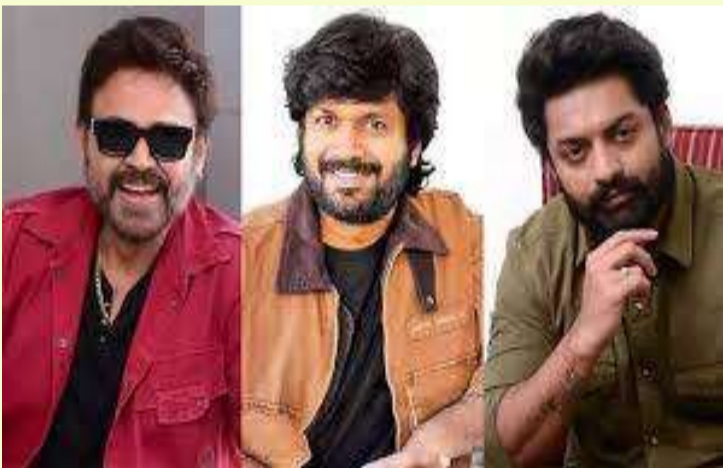
వేద న్యూస్ డెస్క్: