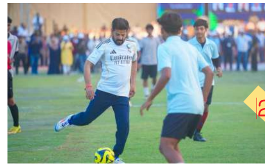
ఎల్బీ స్టేడియంలో క్రీడా సందడి

లెజిస్లేటర్స్ స్ట్రాక్స్ మీట్ ప్రారంభం 14 ఏళ్ల తర్వాత పునఃప్రారంభమైన క్రీడా సంప్రదాయం