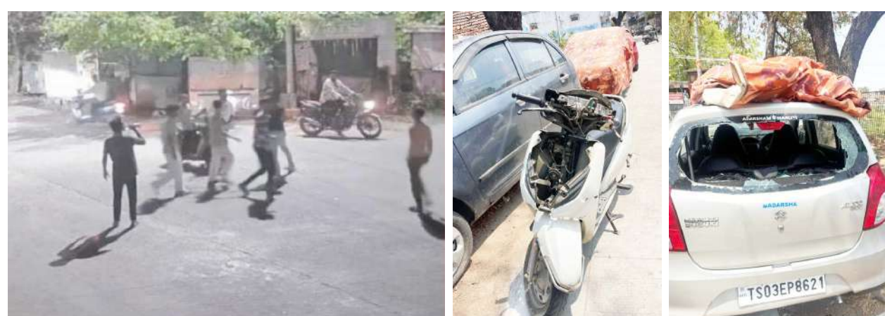
మిల్స్ కాలనీ పోలీస్ స్టేషన్ పరిధిలో ఈ నెల 14వ తేదీ ద్వితీయ కలిమాబాద్ ప్రాంతంలో ద్వితీయ వాహనం పార్క్ ఎత్తుకొన్న వ్యక్తులు విచక్షణ రహితంగా దాడి చేస్తున్న యువకులు