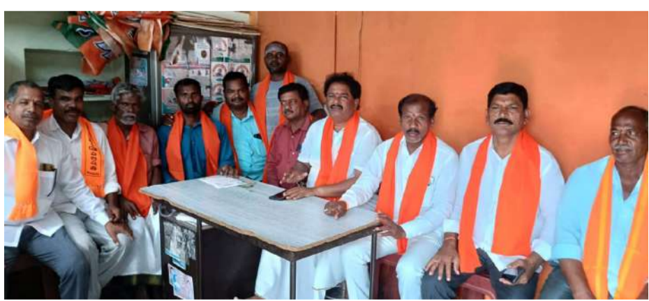
- క్రషర్ ఏర్పాటు నిలిపివేయాలని అధికారులకు వినతి