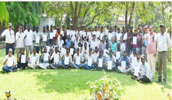
వేద న్యూస్ రామగుండం:

నిరుద్యోగ యువతకు ఉపాధి అవకాశాలు కల్పించేందుకు సింగరేణి సంస్థ చేపట్టిన ఉచిత శిక్షణ కార్యక్రమం ఫలితాలను ఇస్తోంది. రామగుండం-1 ఏరియాలోని టిటిసిలో వోల్టేజీ డంప్ ట్రాక్ డ్రైవింగ్లో యువతకు శిక్షణ అందిస్తూ, వారికి ఉద్యోగ మార్గాలను చూపిస్తోంది. ఇప్పటివరకు 13 బ్యాచ్లలో మొత్తం 651 మంది యువకులు ఈ శిక్షణ పొందారు. వీరిలో 130 మంది ఇప్పటికే వివిధ సంస్థల్లో ఆవరేటర్లుగా ఉద్యోగాలు పొందడం