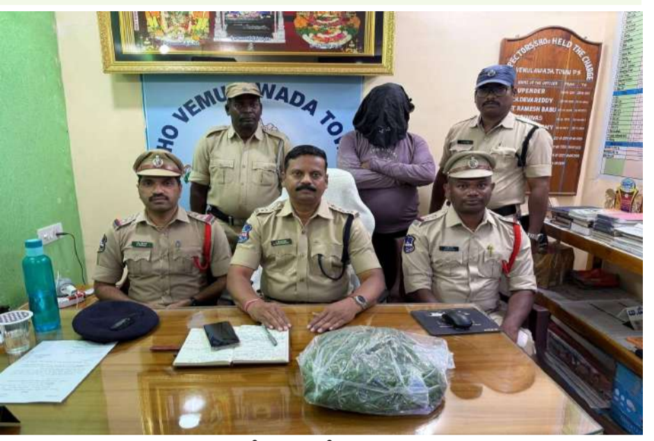
వేద న్యూస్, వేములవాడ:

- అగ్రహారం శివారులో అక్రమ సాగు వెలుగులోకి