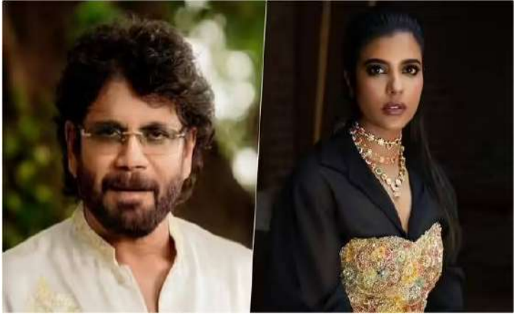
వేద న్యూస్ డెస్క్: