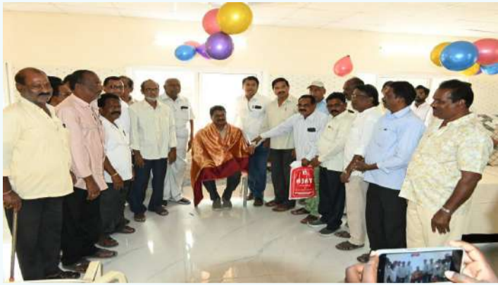
వేద న్యూస్, మండలమల్ల:

మండలమల్ల ఏరియాలోని కేకే-1 డిస్పెన్సరీలో సింగరేణి కార్మికులు, రిటైర్డ్ కార్మికుల సౌకర్యార్థం ఫిజియోథెరపీ కేంద్రాన్ని ఏర్పాటు చేసినందుకు