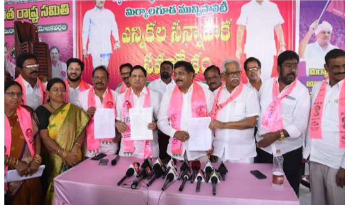
వేద న్యూస్, దామరచర్ల: