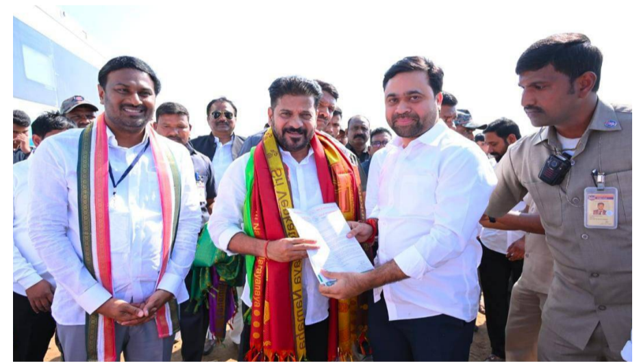
వేద న్యూస్, ఆదిలాబాద్ ప్రతినిధి: