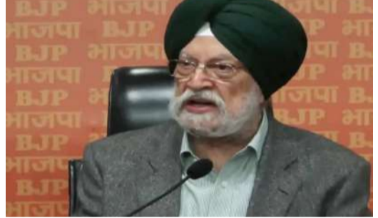
ప్రధాని మోదీ అన్ని రకాల చర్యలు చేపట్టారు!

రాజకీయ నేతలు చేస్తుండటం ఆందోళనకరం. కొవిడ్ తరహా లాక్ డౌన్ ను ఇప్పుడు విధించే అవకాశమే లేదు. పెరుగుతున్న పెట్రోలు, డీజిల్ ధరల ప్రభావం ప్రజలపై పడకూడదని మేం కోరుకుంటున్నాం. అందుకోసమే పెట్రోలు, డీజిల్ పై విధించే ఎక్సైజ్ సుంకాన్ని తగ్గించాం. భారత చమురు కంపెనీలపై భారాన్ని తగ్గించేందుకే ఈ చర్యను చేపట్టాం. గురువారం రాత్రి ప్రధాని మోదీ సారథ్యంలో జరిగిన అత్యవసర సమావేశంలోనే దీనిపై నిర్ణయాన్ని తీసుకున్నాం" అని కేంద్ర ఆర్థిక మంత్రి నిర్మలా సీతారామన్ చెప్పారు.