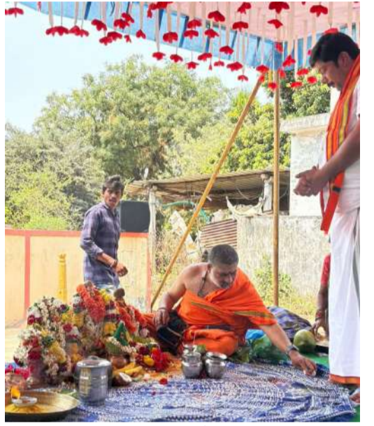
సీతారామల కళ్యాణ వేడుకల్లో పాల్గొన్న బిజెపి నేతలు

ధర్మ పరిరక్షణ్ణి లక్ష్యంగా అడుగులు వేయాలి.