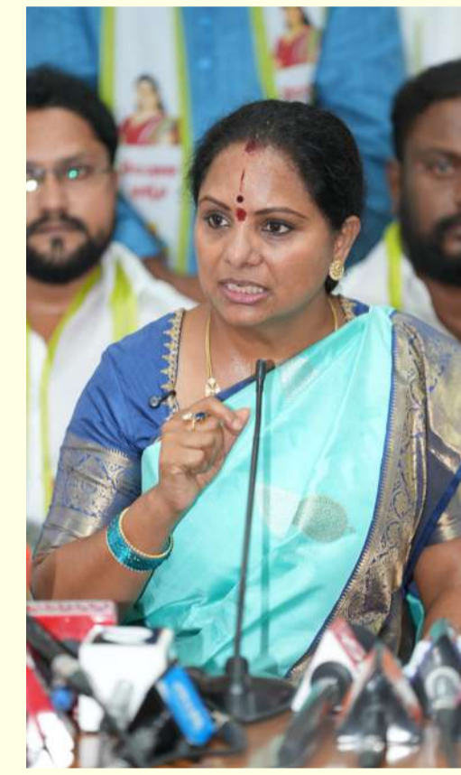
విజ్ఞా జరగనిది ఇప్పుడు అవుతుందా అన్నారు. కానీ మాచేక్షలో నేను ఆ పని చేసే చూపించా అని గుర్తు చేశారు.

చర్యలు, సమాలోచనలను జరిపి ఏప్రిల్ 25న ఉదయం 8 గంటలకు రాజకీయ పార్టీని మేర్పర్ జిల్లా మొయినాబాద్ లో ప్రకటిస్తానని అన్నారు. ఇటీవల టెక్నులజీ భాగితుల కోసం అమరణ నిరాహార దీక్షకు బిసెలస్పెషల్ జేఎస్ఐ ఉద్యమం చేయగా ప్రభుత్వం దిగవచ్చి భాగితులకు ఇండ్లు కట్టించేందుకు ముందుకువచ్చిందని అన్నారు. త్వరలో పెట్టబోయే రాజకీయ పార్టీ ఎజెండా, అతరువాత, పార్టీ పేరును అదే రోజు ప్రకటిస్తానని తెలిపారు. తెలంగాణలో తాను పెట్టబోయే రాజకీయ పార్టీకి తండ్రిగా కేసీఆర్ ఆశీస్సులు తనపై ఉంటాయని అన్నారు. యువత రాజకీయాల దూరంగా ఉండవద్దని కలిసి రాబోయే పలువురిచ్చారు. తెలంగాణ జాగృతి కి గ్రామ గ్రామాన కాన్వెక్షన్లు ఉన్నారని, రాలోయే రెండున్నర సంవత్సరాలలో కొత్త పార్టీని బలోపేతం చేస్తానని అన్నారు. ఇప్పటికీ చాలా మంది లీడర్లు, ప్రజా ప్రతినిధులు తనతో టచ్ లో ఉన్నప్పటికీ తనకు ప్రజా బలం ముఖ్యమని కాన్వెక్షన్ ఆలోచన విధానం మేరకు పార్టీ ఏర్పాటు చేస్తున్నట్లు కల్వకుంట్ల కవిత అన్నారు. ఢిల్లీలో లాబీయింగ్ చేయగలను. గల్ఫ్లో కష్టపడగలను నేను ఎంపీ అయినప్పుడు నిజామాబాద్- పెద్దపల్లి రైల్వే లైన్ పూర్తి చేస్తానని అంటే నవ్వారు. 25