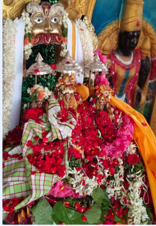
ఇబ్బంది లేకుండా ఆలయ కమిటీ అధ్యక్షులతో అన్ని ఏర్పాట్లు చేశారు.