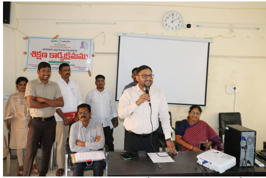
రూపకల్పన, ప్రభుత్వం అమలు చేస్తున్న కుటుంబ సంక్షేమం, విద్య, ప్రజారోగ్యం, సామాజిక అభివృద్ధి వంటి అంశాలపై ఈ శిక్షణలో అవగాహన కల్పిస్తున్నామని పేర్కొన్నారు. అందువల్ల ప్రతి ఒక్క సర్పంచ్ ఈ శిక్షణను సద్వినియోగం చేసుకోవాలని కోరారు. తద్వారా తమ గ్రామాలను ఆదర్శ గ్రామాలుగా