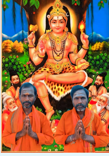
పెదల మండలం మార్చి 04 (వార) నిర్వయం