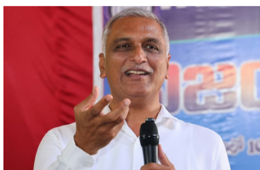
ఈవెంట్లూ మార్కుకోవడం, గొప్పగా చెప్పుకోవడం ఈ ప్రభుత్వానికే చెల్లిందన్నారు. సోలార్ విద్యుత్, వ్యూహరణం, డ్రగ్స్ నియంత్రణ వంటి అంశాల్ని కేవలం పత్రికల్లో పబ్లిసిటీ కోసమే తప్ప, ప్రభుత్వానికి ఏమాత్రం చిత్తశుద్ధి లేదని స్పష్టం చేశారు.

ప్రస్తావిస్తూ ప్రభుత్వంపై నిప్పులు చెరిగారు. పంట కోతల సమయం వచ్చినా ఈ సీజన్ రైతు భరోసా ఇవ్వలేదని, గత సీజన్ పంట బోసన్ ఎగ్జిక్యూటివ్ ఆగ్రహం వ్యక్తం చేశారు.