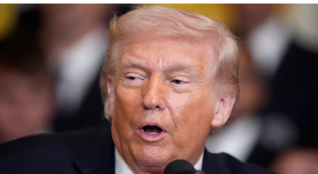
అదిలా ఉండగా, ఎఫ్ టీఎన్ కేసుకు సంబంధించిన పుస్తకం డొనాల్డ్ ట్రంప్ ప్రభుత్వం ఎలా నిర్వహించిందన్న అంశంపై అమెరికాలో రాజకీయంగా తీవ్ర చర్చ జరుగుతోంది.

కూడా పేర్కొన్నట్లు పత్రాల్లో సమాచారం ఉంది. ఆ ఘటన తర్వాత ఈ విషయాన్ని ఎవరికి చెప్పాడని తనకు మరియు తన కుటుంబ సభ్యులకు తెలియించు కాలేదు వచ్చాయని ఆమె చెప్పినట్లు వెల్లడైంది.