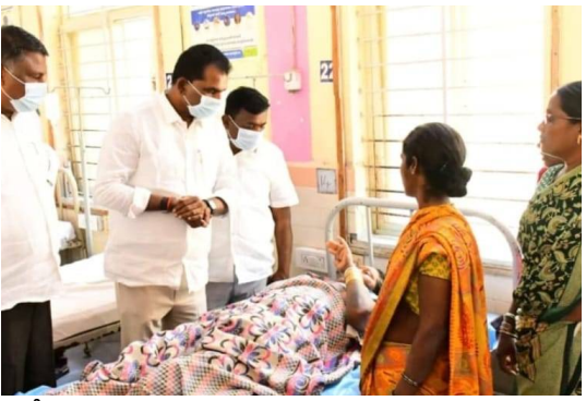
పార్టీ కార్యక్రమాల నాయకులు తదితరులు పాల్గొన్నారు.