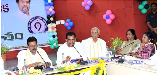
ఉందని అలాంటి సమస్య లేకుండా సంబంధిత అధికారులు పరిష్కరించాలన్నారు. ప్రజా రవాణాకు సంబంధించి ఆటోలలో ఇతరత్రా రవాణా వాహనాలలో ఎక్కువమందిని కూర్చోబెట్టడం వల్ల ప్రమాదాలు జరిగిన సమయంలో ఎక్కువమంది ప్రాణాలు కోల్పోతున్నారని ఆర్ టివో అధికారులు దృష్టి సారించి ప్రమాదాల నివారణ పై చర్యలు తీసుకోవాలన్నారు. ముఖ్యమంత్రి సొంత జిల్లాలో అభివృద్ధి పనులపై అధికారులు ప్రత్యేక దృష్టి సారించాలని ఆయన సూచించారు

అధికారులు పాల్గొన్నారట అంటే శాఖకు సంబంధించిన చిన్న సమస్యలపై అధికారులు ప్రత్యేక దృష్టి సారించకపోవడంతో అవి ఏళ్ల తరబడిగా అపరిష్కృతంగానే ఉంటున్నాయని ఆయన మంత్రిగారు దృష్టికి తీసుకువచ్చారు. జిల్లా హాస్పిటల్స్ లో అత్యవసర వైద్య సేవల కోసం వచ్చే వారిని హైదరాబాద్ సిఫారసు చేస్తున్నారని ఆస్తులలో కావలసిన అన్ని సదుపాయాల ఏర్పాటు కోసం మంత్రి దృష్టి సారించారని ఆయన కోరారు సమగ్రంగా యూరియా ఉన్న చిన్న చిన్న సమస్యలతో రైతులు ఇబ్బంది పడుతున్నారని ఆన్లైన్ బుకింగ్ లాంటి వాటిపై వ్యవసాయ శాఖ అధికారులు దృష్టి సారించేలా చర్యలు తీసుకోవాలన్నారని బిజినెస్ సంబంధించి బోస్ట్ లు నిర్మించుకుని లబ్ధిదారులకు డిబ్బుల చెల్లింపులో పూర్తిస్థాయి అవగాహన లేదని లబ్ధిదారులకు అందుకు సంబంధించిన అవగాహన కల్పించేలా చూడాలని ఆయన సూచించారు వ్యవసాయానికి సంబంధించి విద్యుత్ సరఫరాలో కొన్ని ప్రాంతాల్లో ఒకలాగా మరొకటి ప్రాంతాల్లో ఇంకొకలా