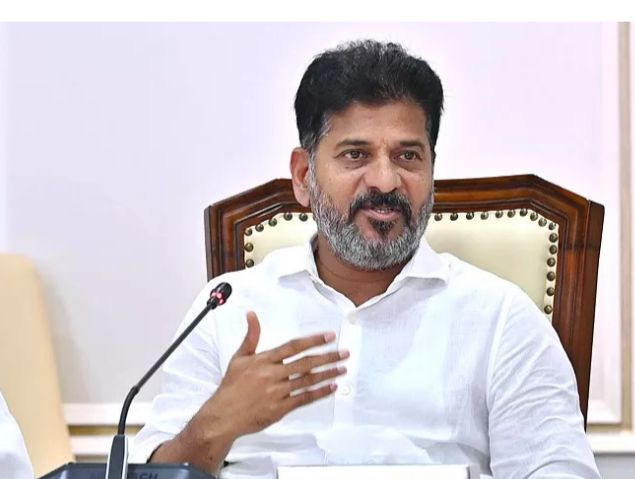
స్పష్టం చేశారు. సుప్రీంకోర్టు ఆదేశాల తర్వాత, వర్గీకరణ కోసం ప్రకటన చేసిన తొలి రాష్ట్రం తెలంగాణనే ఈ సందర్భంగా గుర్తు చేశారు. తమ ప్రభుత్వానికే పెండింగ్ పైజ్జను కేసుల్లో నెట్టుకొస్తారని తెలిపారు.

వివరించారు. తమది పేదల పక్షపాత ప్రభుత్వమని సీఎం రేవంత్ రెడ్డి అభివర్ణించారు. గత పాలకులు ఎన్నో అక్రమాల చేశారని సీఎం రేవంత్ విమర్శించారు.