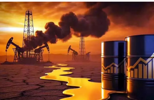
మారింది. ఖతార్లోని అతిపెద్దైన రాన్ లిఫ్టాన్ ఎల్ఎన్ఐఐ ఫ్లాంట్ పై ఇరాన్ ద్రోన్ దాడి చేసింది. ఈ దాడి కారణంగా జరిగిన నష్టాన్ని ఖతార్ ఎన్ఫీఐ ఇంకా అంచనా వేస్తోంది.

మధ్యప్రాచ్యంలో కొనసాగుతున్న యుద్ధం ప్రపంచ ఆర్థిక వ్యవస్థను కోలుకోలేని దెబ్బ తీసేలా కనిపిస్తోంది. గల్ఫ్ దేశాల నుండి చమురు సరఫరా నిలిచిపోతే, అంతర్జాతీయ మార్కెట్లో ముడి చమురు ధర బ్యాంకెట్ 150 డాలర్ల(భారతీయ కరెన్సీలో సుమారు రూ.13783)కు చేరుకోవచ్చని ఖతార్ ఇంధన శాఖ మంత్రి సాద్ అల్-కాబీ హెచ్చరించారు.