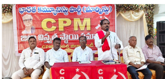
చెప్పారు. ఇటీవల తీసుకొచ్చిన నాలుగు తేబర్ కోడ్స్ ను రద్దు చేసే వరకు దేశంలో సిపిఎం అధ్యక్షులలో ఉద్యమాలు పోరాటాలు సమైలు వంటివి చేపట్టి పాత కార్మిక చట్టాలను పునరుద్ధరించుకునేలా ఉద్యమాలు నడపాలని అవసరం ఉందని తెలిపారు. ప్రజలకు సత్వం చేకూర్చే ఎలాంటి చట్టాన్ని అయినా సిపిఎం తీవ్రంగా వ్యతిరేకిస్తుందని చెప్పారు. ఇటీవల కాలంలో దేశంలో రాష్ట్రంలో విపరీతమైన కుల అసమానతలతో కూడిన దాడులు పెరుగుతున్నాయని, వాటిని సిపిఎం ఖండిస్తుందన్నారు. నాగర్ కర్నూలు జిల్లా కమ్యూర గ్రామంలో జాతర సందర్భంగా అగ్రవర్ణాల పెత్తందారులు గ్రామానికి చెందిన ఒక కుటుంబం పై దాడి చేసి రెండు నెలల పనికిందును హత్య చేశారని, ఈ ఘటనలో రాజకీయ జోర్యం లేకుండా దోషులను అరెస్టు చేసి కఠినంగా శిక్షించాలని డిమాండ్ చేశారు. దోషులపై ఎస్సీ ఎస్సీ అట్రాసిటీ కేసులు నమోదు చేయడంతో పాటు అత్యంత కఠినమైన సెక్షన్లను విధించి దుర్మార్గులను కఠినంగా శిక్షించేందుకు ప్రభుత్వం చాలవరగా చర్యలు తీసుకోవాలని డిమాండ్ చేశారు. రాష్ట్రంలో ఆర్ గ్యారంటీలు ఉన్నాయని వాటిని సంపూర్ణంగా అమలు చేసే బాధ్యత సీఎం రేవంత్ రెడ్డి తీసుకోవాలని డిమాండ్ చేశారు. ఈ సమావేశంలో సిపిఎం జిల్లా కార్యదర్శి పుట్ల ఆంజనేయులు, జిల్లా కార్యదర్శి వర్ల సభ్యులు ఎం.డి జబ్బార, జిల్లా కార్యదర్శి వర్ల సభ్యులు ఎం.రాజు, జిల్లాకమిటీ సభ్యులు జి వెంకటయ్య బాల్య నాయక్ వెంకట్ రామకుమార్ మేకల ఆంజనేయులు మహబూబ్ పాషా ఎంకట్టేవ్ పరమేశ్వర చారి ఎం కృష్ణయ్య ఎస్ రాజు రేవండ్లు సిపిఎం గ్రామ సర్పంచ్ నిరంజన్ పిల్లరాలపల్లి తెల్ల రాజ్ పల్లి సిపిఎం గ్రామ సర్పంచ్ జంబులయ్య సిపిఎం వనపర్తి 18 వ వార్డు కౌన్సిలర్ గంధం మదన్, మండల, శాఖా కార్యదర్శులు, సీనియర్ నాయకులు పాల్గొన్నారు.