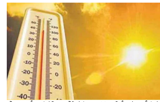
ప్రాంతాల్లో పగటి ఉష్ణోగ్రతలు 40 డిగ్రీలకు చేరుకునే అవకాశం ఉందని వాతావరణశాఖ అధికారులు హెచ్చరిస్తున్నారు.

దృష్టిలో ఉంచుకుని శని, ఆదివారాలకు రాష్ట్రానికి ఎల్లో అలెట్ కూడా జారీ చేశారు. శనివారం రాష్ట్ర వ్యాప్తంగా పగటిపూట 37 డిగ్రీల కంటే పైగా ఉష్ణోగ్రతలు నమోదయ్యాయి. ములుగు జిల్లా మంగపేట మండలం మల్లూరులో అత్యధికంగా 39 డిగ్రీల ఉష్ణోగ్రత నమోదైంది. ఆదిలాబాద్, జగిత్యాల జిల్లా ధర్మపురిలో 38.9 డిగ్రీల చొప్పున గరిష్ట ఉష్ణోగ్రతలు నమోదయ్యాయి. హైదరాబాద్ లో కూడా ఎండ తీవ్రత పెరుగుతోంది. ఎల్బీసీగల్లో 37.8 డిగ్రీలు, మెహదీపట్నంలో 37 డిగ్రీల గరిష్ట ఉష్ణోగ్రతలు నమోదయ్యాయి. నగరంలో సాధారణం కంటే రెండు డిగ్రీలు ఎక్కువ ఉష్ణోగ్రతలు నమోదవుతున్నాయని వాతావరణశాఖ వెల్లడించింది. ఇలాగే ఎండ తీవ్రత కొనసాగితే వారం రోజుల్లో రాష్ట్రంలోని పలు