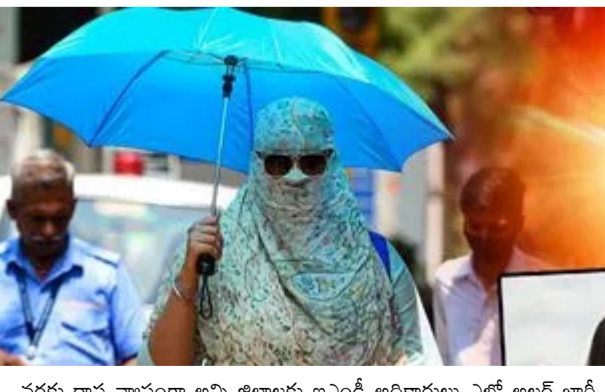
అదిలాబాద్, ఖమ్మంలో 38 డిగ్రీలు.. రామగుండం, నిజామాబాద్, హైదరాబాద్, దుండిగల్, హాకింపేట్ ప్రాంతాల్లో 37 డిగ్రీల వరకు ఉష్ణోగ్రతలు రికార్డు అయ్యాయి. శనివారం(మార్చి 7) నుంచి సోమవారం(మార్చి 9)

వరకు రాష్ట్ర వ్యాప్తంగా అన్ని జిల్లాలకు ఐఎండ్ అధికారులు ఎల్లో అల్లర్ల జారి చేశారు. గత ఏడాదితో పోలిస్తే ఈ ఏడాది ఎండల తీవ్రత ఎక్కువగా ఉండవలసి అధికారులు అంచనా వేస్తున్నారు. సాధారణం కంటే 2 నుంచి 4 డిగ్రీలు అధికంగా గరిష్ట ఉష్ణోగ్రతలు సమాదంతుతుంది. హైదరాబాద్ లోనూ గత రెండు రోజుల్లో 2 డిగ్రీలు పెరిగాయని అధికారులు తెలిపారు. పిల్లలు, వృద్ధులు, దీర్ఘకాలిక వ్యాధులు ఉన్నవారు తగిన జాగ్రత్తలు తీసుకోవాలని అధికారులు సూచించారు. గరిష్ట ఉష్ణోగ్రతలు సాధారణం కంటే 5 డిగ్రీలు పైబడితే పడగాలుల అల్లర్ల జారీ చేస్తామని ఐఎండ్ అధికారులు వెల్లడించారు.