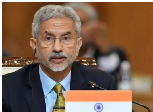
మంది ప్రజలు నివసిస్తున్నారు. ప్రస్తుతం గల్వే దేశాల్లో మనవారు కొంత మంది చిక్కుకున్నారు. మనకు నౌకలను నడిపే వ్యాపారులు ముఖ్యమే కానీ వారి కంటే ప్రజల ప్రయోజనాలనే మన ప్రభుత్వం పరిగణనలోకి తీసుకుంటుంది”

గల్లంతయ్యారన్నారు. ఆ సమయంలో తొలుత లాంగ్-రేంజ్ మిసైల్ పెట్రోలింగ్ విమానాన్ని మన నావి పంపిందని తెలిపారు. తరువాత ఐఎల్-15-ట్రాబుల్ లైట్ రాష్ట్రలతో కూడిన రెండో విమానాన్ని కూడా మన నావి సిద్ధం చేసిందని వెల్లడించారు. ఐఎన్ఎస్ తరంగిణీ నౌక ఆ రోజు సాయంత్రం అక్కడకు చేరుకోగానే తర్వాత కొచ్చి సుంది ఐఎన్ఎస్ ఇక్కడి బయలుదేరి వెళ్లిందన్నారు. “శ్రీలంకలో ఇరాన్ యుద్ధ నౌక ఐఎన్-దేనా జలాంతర్గామిపై అమెరికా దాడి చేసి దానిని ముంచేసింది. దీనిపై సోషల్ మీడియాలో చాలా చర్చ జరుగుతోంది. హిందూ మతా సమన్వయం ఒక మంచి పర్యవరణం కలిగిన ప్రదేశం. ప్రపంచంలోని ఇతర ప్రాంతాల కంటే హిందూ మతాసముద్రం చాలా విభిన్నమైన పర్యావరణం కలిగిన ప్రదేశం, ఇది భారతదేశానికి వాణిజ్యం పరంగా కీలకమైనది. భారతదేశం అభివృద్ధి చెందితే దాని వల్ల హిందూ మతాసముద్రంలో కలిసి ఉన్న ఇతర దేశాలు అభివృద్ధి చెందుతాయి. భారత దేశంలో వ్యాపార నౌకలను చాలా మంది నడుపుతారు. వస్తువులను తీసుకెళ్లే నౌకలపై దాడి జరిగిన ప్రతిసారి నష్టం జరుగుతుంది. మన దేశ ప్రజలకు ఏదీ ఉపయోగపడకుండా దాని గురించి మనం ఆలోచించాలి. గల్వే దేశాల్లో 9-10 మిలియన్ల