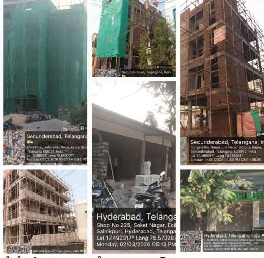
రోడ్డు పాత ఇంటి నీ కమర్షియల్ గా షట్టర్ నిర్మాణం మరియు పద్మశాలి టౌన్షిప్ లోని గ్రౌండ్ ప్లన్ శ్రీ షార్ మరయు చక్రిపురం నాగార్జున నగర్ కాలనీలోని జి ప్లన్ శ్రీ ఈ అక్రమ నిర్మాణాలపై ఇకనైనా కాప్రా టౌన్ ప్లానింగ్ అధికారులు పైన పేర్కొన్న నిర్మాణాలపై ఇంతకుముందు కొన్ని సీజ్ చేసిన తరహాలో పై వాటిపై కూడా విచారణ చేపట్టి చట్టరీత్యా తగు చర్యలు తీసుకోవాలని ప్రజలు కోరుతున్నారు.

వక్షపాత వైఖరి అవలంబిస్తున్నారు. అని సామాన్య మధ్యతరగతి ప్రజలు విస్మయానికి గురవుతున్నారు. ఇలాంటి నిబంధనలు లేని నిర్మాణాలపై వత్తికలలో వచ్చిన వార్తలను టౌన్ ప్లానింగ్ అధికారులు పెదవెవిన పెడుతున్నారు. అలాంటి కాప్రా టౌన్ ప్లానింగ్ అధికారులు మధ్యతరగతి ప్రజల ఇండ్లను మాత్రం ఎందుకు సీజ్ చేస్తున్నారు. అని కాప్రా ప్రజలు విస్మయానికి గురవుతున్నారు. నిబంధనలు లేని నిర్మాణాలపై ఆ ఏరియా చైర్మన్ లకు సమాచారం ఇచ్చినా వారి పనితీరు పారదర్శకంగా లేకుండా పోయింది. అలాంటి అక్రమ నిర్మాణాలపై పూర్తిస్థాయిలో చర్యలు తీసుకోవడం లేదు. చైర్మన్ లను ఇందుకు సంబంధించి సమాధానం అడిగినప్పుడు.... ఇందులో మా ప్రయత్నం మేము చేసాము ఇకపై పూర్తి అధికారం పై అధికారి చేతిలో ఉన్నాయి. అందువల్లనే ఆలస్యం అవుతుంది. అని చైర్మన్ మేస్తు సమాధానం చెబుతున్నారు. ఇంతకుముందు భారీ ఎత్తున కొన్ని నిబంధనలు లేని నిర్మాణాలని సీజ్ చేశారు. మరి అనుమతులు లేని భారీ కమర్షియల్ మరియు భారీ రేకుల షట్టర్ నిర్మాణాలపై ఎలాంటి చర్యలు తీసుకోకపోవడంతో కాప్రా మున్సిపల్ ప్రజలు అధికారులపై తీవ్ర స్థాయిలో మండిపడుతున్నారు. కాప్రా పంచుగూడ రోడ్డు శనివారం మార్కెట్ రోడ్డులో రెండు ప్లాట్లలో రేకుల షట్టర్ నిర్మాణం మరియు పెంట్ హౌస్ గ్రౌండ్ నిర్మాణం, కాప్రా ఓల్డ్ విలేజ్