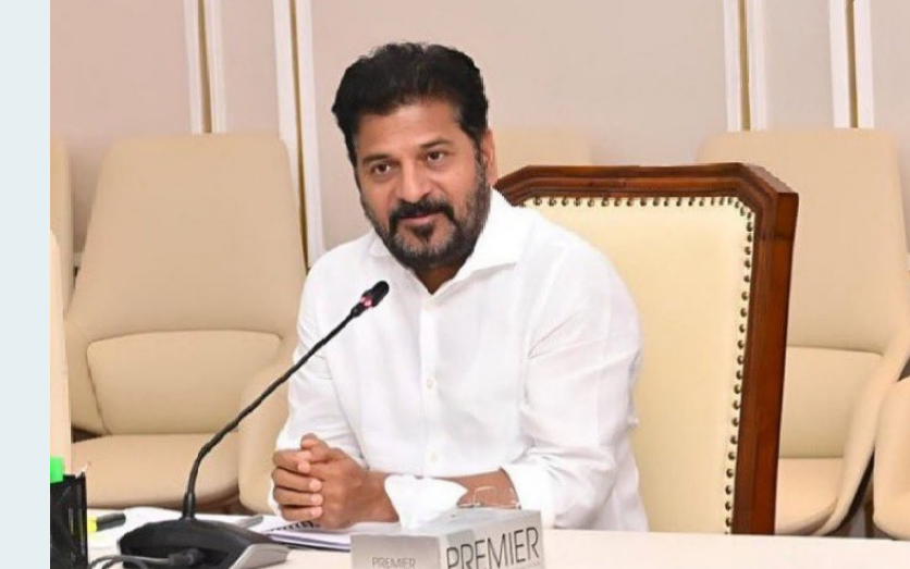
గురించి చెప్పారు. 1995లో సీఎం ఆయ్యాక ఐటీ రంగానికి విస్తరణ ప్రారంభం చేశారు. 1995లో సీఎం ఆయ్యాక ఐటీ రంగానికి విస్తరణ ప్రారంభం చేశారు.

భవిష్యత్తులో గ్లోబల్ కమ్యూనిటీకి సేవ చేసే సామర్థ్యం భారత్ కి ఉందని సీఎం అన్నారు. భవిష్యత్తులో అనేక దేశాలకు విద్యుత్ ఇస్తారు: ఐటీలో భారతీయుల పరిజ్ఞానం అందరికీ తెలిసిందేని ఆయన వ్యాఖ్యానించారు. అనేక దేశాల అభివృద్ధిలో భారతీయుల పాత్ర ఉందన్నారు. గ్రీన్ ఎనర్జీ ఉత్పత్తి దిశగా భారత్ దూసుకెళ్తోందన్న సీఎం చంద్రబాబు, మన దేశం భవిష్యత్తులో అనేక దేశాలకు విద్యుత్ ఇస్తుందన్నారు. డిఫైజు, ఫైక్సిబిలిటీ విషయాల్లో భారతీయులకు మంచి పేరుందని తెలిపారు. అమరావతిలో క్రియేటివ్ సీటీ: విదేశాలకు వెళ్లే విద్యార్థుల్లో ఎక్కువ శాతం ఏపీ వాళ్లే ఉన్నారని, ప్రపంచ అత్యుత్తమ ఉపసెన్ట్రి పనిచేసే వారిలోనూ మన వాళ్లే ఎక్కువగా ఉన్నారని సీఎం అన్నారు. విభిన్నంగా ఆలోచించే వారి కోసం అమరావతిలో క్రియేటివ్ సీటీ నిర్మిస్తున్నట్లు పేర్కొన్నారు. ఏపీలో డ్రాస్ సీటీ, ఏరో స్పేస్, ఎలక్ట్రోనిక్స్ సీటీ నిర్మిస్తున్నామన్నారు. భవిష్యత్తులో ఆరోగ్యరంగంలో పెనుమార్పులు వస్తాయని సీఎం చంద్రబాబు తెలిపారు. త్వరలో డ్రాస్ అంబులెన్సీలు కూడా వస్తున్నాయని వివరించారు. '3 రహస్యాల క్రితమే ఐటీ విస్తరణ