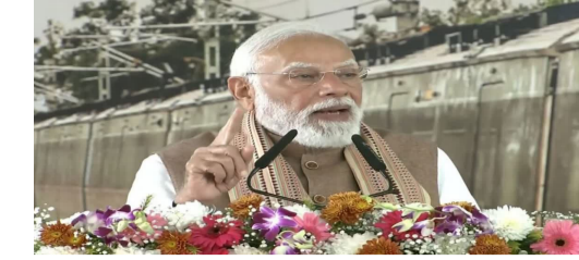
కుంభకోణాల వల్లే అభివృద్ధి జరగలేదు : మోదీ

అనంతరం అక్కడే విద్యుత్తు చేసిన బహిరంగ సభలో మాట్లాడుతూ ఈ మేరకు వ్యాఖ్యలు చేశారు. కాంగ్రెస్ నాయకులు మోదీని ద్వేషిస్తారు. వారు నా నా సమాధిని తవ్వాలని చూస్తున్నారు. నా తల్లిని అవమానించడానికి కూడా వెనుకాకడదు. ఏట గోబిల్ సమ్మిట్ బీజేపీ కార్యక్రమం కాదు. ఆ సమ్మిట్ కు ఏ బీజేపీ నాయకులు హాజరు కాలేదని కాంగ్రెస్ గుర్తుచుకోవాలి. ఇది దేశం గర్వంచే పని. కానీ కాంగ్రెస్ జాతీయ గౌరవాన్ని ఉల్లంఘించింది. కాంగ్రెస్ ఈ అవినీతి విధానాన్ని దేశం మొత్తం ఖండిస్తోంది. ప్రపంచంలోని అనేక అభివృద్ధి చెందిన దేశాలు ఇప్పుడు భారత్ తో వాణిజ్య ఒప్పందాలు చేసుకుంటున్నాయి. కాంగ్రెస్ ప్రభుత్వం కోరుకున్నప్పటికీ, అభివృద్ధి చెందిన దేశాలతో ఒప్పందాలు చేసుకోలేకపోయాయి. ఎందుకంటే అప్పట్లో, స్వామీలకు పేరుగాంచిన కాంగ్రెస్ ప్రభుత్వంతో వ్యవహరించడానికి ప్రపంచం సంతోషించింది. కానీ నేడు, అభివృద్ధి చెందిన దేశాలు భారత్ తో వాణిజ్యం చేసేందుకు ఆసక్తిగా ఉన్నాయి. ఇప్పుడు 21వ శతాబ్దపు సమాఖ్య పరిష్కారాలను అందించగల శక్తి భారత్ అని ప్రపంచం భవిష్యోంది' అని ప్రధాని మోదీ అన్నారు.