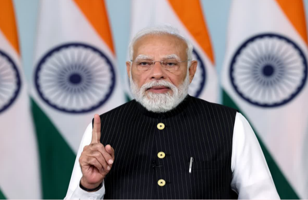
యోజన' కింద 56 లక్షల మంది సీనియర్ సీటిజెన్స్ కు ఊరట కల్పించాం. 'ఉజ్వల యోజన' ద్వారా కోటి కుటుంబాలకు ఎలీజీ కనెక్ట్ లను అందించాం. తర్వాత మార్కెట్ మార్పులను, సోదరీమణులను పోగ నుంచి విముక్తి కల్పించాం."

గత 11 ఏళ్లుగా దేశ ప్రజల ఆశీర్వాదంలో తమ ప్రభుత్వం ప్రజా సంక్షేమం, సమగ్ర అభివృద్ధికి అత్యధిక ప్రాధాన్యతనిచ్చిందని ప్రధాని మోదీ పేర్కొన్నారు. రైతుల సంక్షేమం నుంచి యువత కలలను నెరవేర్చడం వరకు, మహిళలను సాధికారపరచడం నుంచి సమాజంలోని ప్రతి వర్గాన్ని చేరుకోవడం వరకు తమ ప్రభుత్వ విధానాలు, నిరంతర ప్రయత్నాల సానుకూల ఫలితాలు నేడు స్పష్టంగా కనిపిస్తున్నాయని అన్నారు. ఈ క్రమంలో బంగారీలో అధికారంలో ఉన్న డిఎంసీ సర్కార్ పై మోదీ మండిపడ్డారు. "బంగారీ ప్రభుత్వం నుంచి సరైన సహకారం లేకపోయినా రాష్ట్రంలో దాదాపు 5 కోట్ల మంది ప్రజల చేత 'జన ధన్ యోజన' తాళాలు ఓపెన్ చేయించాం. 'స్వస్థ భారత్ అభియాన్' కింద రాష్ట్రంలో 85 లక్షల మరుగుదొడ్లు నిర్మించాం. బంగారీలను పార్లమెంట్ డిఎంసీ సర్కార్ చేపడే జీవనోపాధిని లాక్కుంటోంది. మేము మాత్రం చిరు వ్యాపారులు, వ్యవసాయకులకు రూ.2.82 లక్షల కోట్ల విలువైన రుణాలు అందించాం. 'అటల్ బెన్స్ లెన్