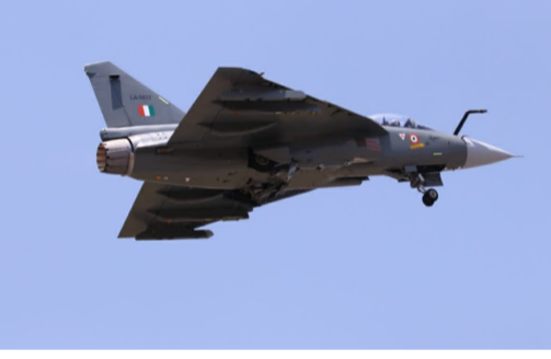
తేజస్ అంటే కాంతి, శక్తి అనే అర్థం.

హిందుస్థాన్ విరోహాల్ని తిమిరివే తయారు చేసిన ఎల్సీఎ తేజస్ ఒక సింగిల్ సీట్, మల్టీ రోల్ ఫైటర్ జెట్. దీన్ని ఏరానాచీలో డెవలప్ మెంట్ విజ్ఞాన అభివృద్ధి చేసింది. గగనతల లక్షణ, సమగ్ర పర్యవేక్షణ, కచ్చితమైన దారులు వంటి అనేక విషయాలకు అనువుగా ఆ విమానాన్ని రూపొందించారు. 2003లో అప్పటి ప్రధానమంత్రి అటల్ బిహారీ వాజ్ పేయా దీనికి తేజస్ అనే పేరు పెట్టారు. సంస్కృతంలో