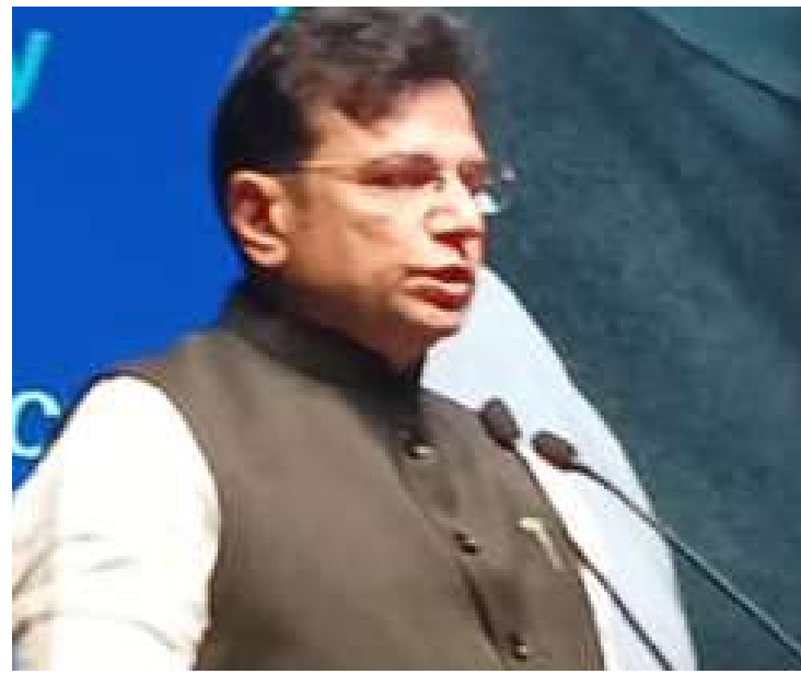
జనోదయ : హైదరాబాద్:

దేటా సైన్స్, డిజిటల్ ఆవిష్కరణలతో 'హెల్త్ కేర్' అనుసంధానం సైన్స్, దేటా, హ్యూమానిటీ కలిసి పనిచేస్తేనే సమాజానికి మేలు రాష్ట్ర ఐటీ, పరిశ్రమల శాఖ మంత్రి దుబ్బిళ్ల శ్రీధర్ బాబు