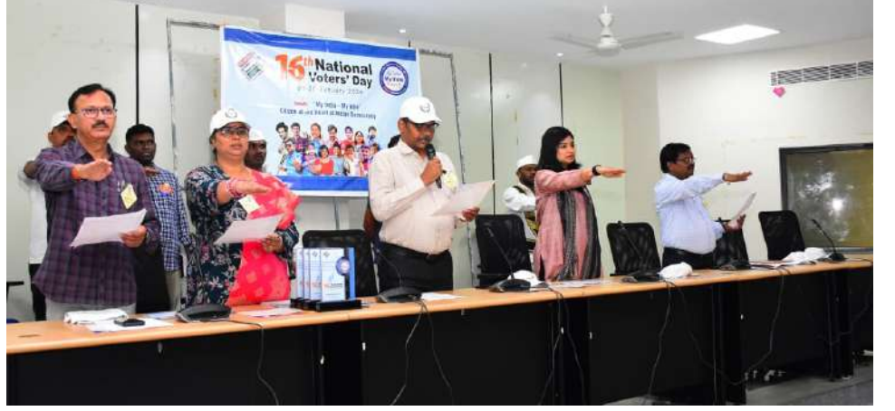
పేర్కొన్నారు. సీనియర్, నూతన ఓటర్లకు సన్మానం

నమోదు, ఎథికల్ ఓటింగ్ పై అవగాహన కల్పించేందుకు ప్రతి సంవత్సరం జనవరి 25న జాతీయ ఓటరు దినోత్సవంగా వేడుకలు నిర్వహిస్తామని వివరించారు. 18 ఏండ్ల వయసు వచ్చిన వారు అందరూ ఓటు వేయవచ్చని, నిర్ణీత వయసు వచ్చిన వారు అన్ని ఎన్నికల్లో పోటీ చేసే హక్కు ఉందని తెలిపారు. ఓటు హక్కు నమోదు అనేది నిరంతర ప్రక్రియ అని, దీనికి ఎంతో మంది అధికారులు సేవలు అందిస్తారని