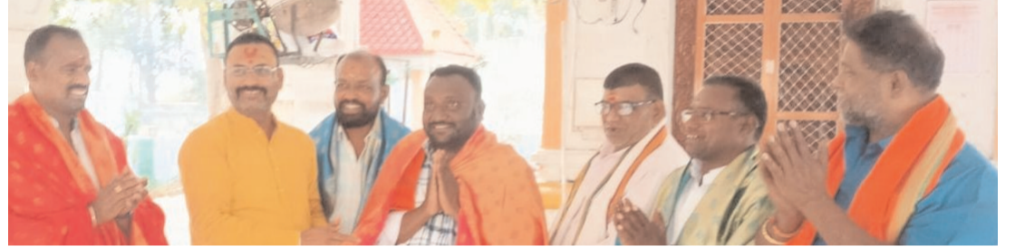
బాధ్యతలు చేపట్టిన నూతన కమిటీ సభ్యులు

పట్టణంలోని హరిహర దేవస్థానంలో వసంత పంచమి పర్వదినం, ఆలయ రజతోత్సవ వేడుకలను ఆత్మీయ వైభవంగా నిర్వహించారు. శుక్రవారం వసంత పంచమి పర్వదినాన్ని పురస్కరించుకుని ఆలయంలో ప్రత్యేక పూజా కార్యక్రమాలు చేపట్టారు. ఉదయం గణపతి హోమంతో పూజా కార్యక్రమాలు ప్రారంభించి, స్వామివారికి శాస్త్రోక్తంగా అభిషేకాలు, మధ్యాహ్నం శాస్త్రాప్రీతి కార్యక్రమాలను భక్తిశ్రద్ధలతో నిర్వహించారు.