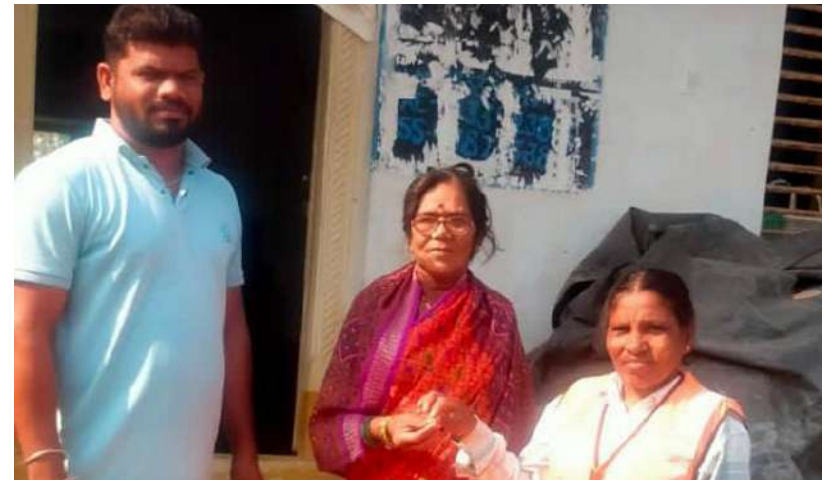
జనోదయ, బెల్లంపల్లి, మార్చి 13: