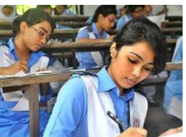
భావించాలని సూచించారు. విద్యార్థులు ఆత్మవిశ్వాసంతో, సానుకూల దృక్పథంతో ముందుకు సాగాలని పేర్కొన్నారు.

చేయగా 5,17,727 మంది విద్యార్థులు పరీక్షలకు హాజరుకాబోతున్నారు. ఆన్లైన్ బుక్ లెటిలోని పేజీలను చివరికి విద్యార్థులపై మాల్ ప్రాక్టీస్ కేసులు నమోదు చేస్తామని అధికారులు హెచ్చరించారు. గవర్నర్ శుభాకాంక్షలు.. పదో తరగతి వార్షిక పరీక్షలకు హాజరవుతున్న విద్యార్థులకు గవర్నర్ శివప్రతాప్ శుక్లా శుభాకాంక్షలు తెలిపారు. పరీక్షలను ఒత్తిడిగా భావించ కూడా జ్ఞానం, ప్రతిభను చూపించే అవకాశంగా