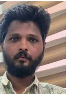
జనోదయ: శేలింగంపల్లి మార్చి 13:

-నిందితుడిని పట్టుకున్న సైబర్ క్రైమ్ పోలీసులు