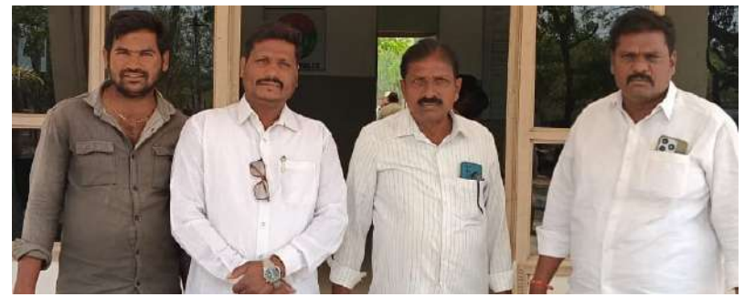
జనోదయ :చెన్నూరు ఆర్టీ