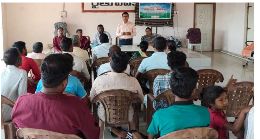
జనోదయ, మండమర్రి మార్చి 14: