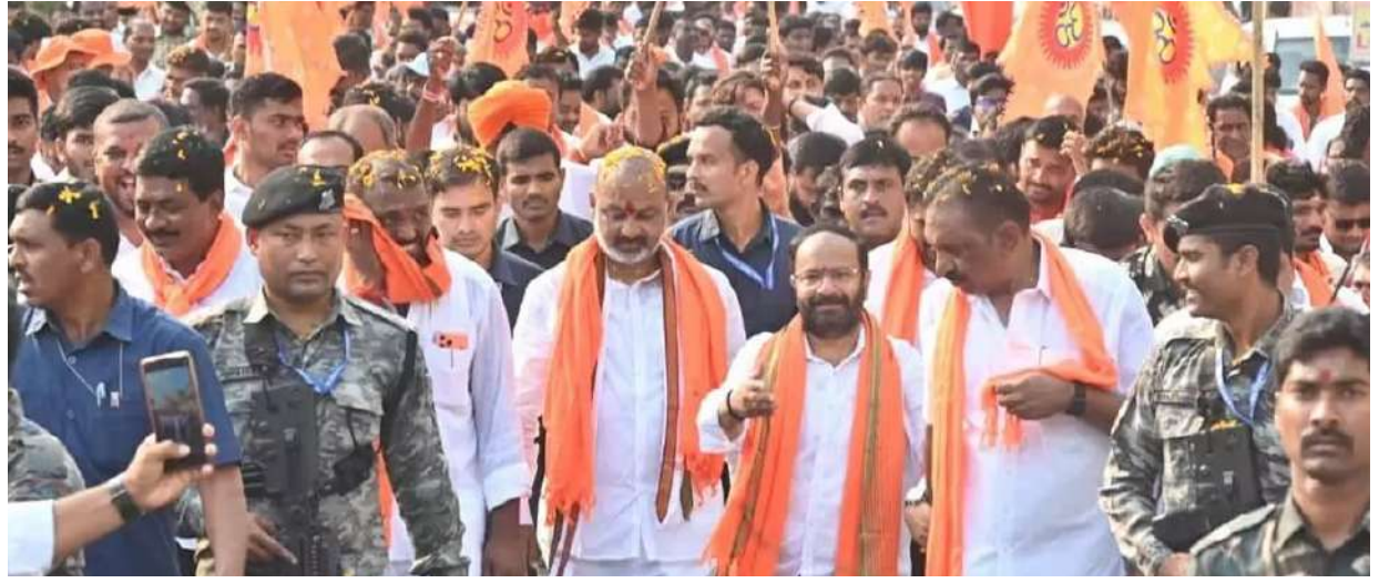
కరీంనగర్, మార్చి 14 : సమాజానికి మంచి చేయాలని, తమను గెలిపించిన ప్రజల అభ్యున్నతి కోసం పాటుపడాలని కోరుతూ అంజన్ ఆలయానికి పాదయాత్రగా వెళ్తున్నామని కేంద్ర హోం శాఖ సాయ మంత్రి ఉండి సంతకం చేశారు. శనివారం ఉదయం కరీంనగర్ లోని మహాశక్తి ఆలయం వద్ద అంజన్ ఆశీర్వాద యాత్రను ప్రారంభించిన అనంతరం ఆయన మీడియాతో మాట్లాడారు. కరీంనగర్ పార్లమెంట్ నియోజకవర్గ పరిధిలో పంచాయతీ మున్సిపల్ ఎన్నికల్లో గెలిచిన బీజేపీ ప్రజా ప్రతినిధులతో కలిసి కొండగట్టు అంజన్ ఆలయం వద్దకు వస్తానని

ఎన్నికల ప్రచార సభల్లో ప్రకటించామన్నారు. దానికనుగుణంగా పార్లమెంట్ పరిధిలోని వార్డు సభ్యులు, సర్పంచులు, కౌన్సిలర్లు, మేయర్, డిప్యూటీ మేయర్, కార్పొరేటర్లు, వార్డు సభ్యులతో కలిసి మహాపాదయాత్ర చేపడుతున్నామన్నారు. నిత్యం కొలిచే మహాశక్తి అమ్మవారి ఆలయం నుంచే కొండగట్టుకు ఆధ్యాత్మిక యాత్రను ప్రారంభించడం సంతోషంగా ఉందన్నారు. పదో తరగతి విద్యార్థులు ఆందోళనకు గురి కావద్దని, కష్టపడి చదివారని, ఇష్టపడి రాయాలన్నారు. పదో తరగతి పరీక్షలు ఉన్నందున విద్యార్థులకు ఇబ్బందులు లేకుండాపాదయాత్ర చేపట్టాలని సూచించారు.