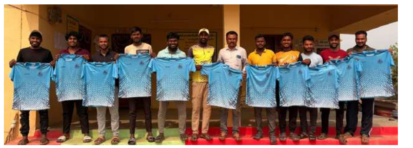
వాస్తవం, దొల్తాబాద్, మార్చి 15: