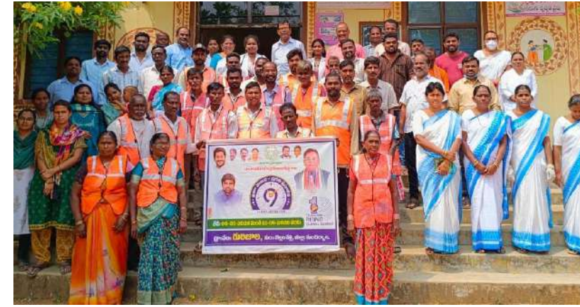
జనోదయ, బెల్లంపల్లి, మార్చి 18:

జంధ్యం (గాయత్రి) ధరించడం ఆచారంగా పాటిస్తారు. ఇటు గ్రామాలలో మూడు రోజులతో పాటు పూజలు నిర్వహించి మూడో రోజు ఉద్వాసన పలుకుతారు అలాగే పట్టణంలోనీ విశ్వబ్రాహ్మణ సంఘంలో తొమ్మిది రోజులపాటు మహమ్మాయి అమ్మవారి నవరాత్రులు విశ్వబ్రాహ్మణ విశ్వకర్మలు ఘనంగా నిర్వహిస్తారు.