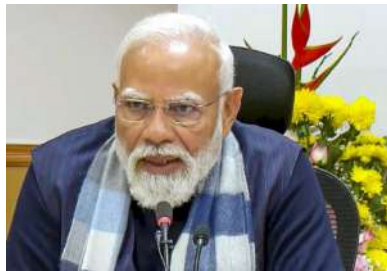
సరిపోవు నిల్వలు ఉండేలా చూసుకోవడం, ప్రపంచవ్యాప్తంగా వస్తున్న మార్పులను గమనించడం వంటి వాటిపై దృష్టి సారించారు.

రు. ప్రజలకు ఎలాంటి ఇబ్బందులు తలెత్తకుండా అత్యవసరాలైన గ్యాస్, విద్యుత్, ఎరువుల పంపిణీలో అంతరాయం లేకుండా చూడాలని మోదీ సూచించారు. మూడు వారాలకు పైగా జరుగుతున్న పశ్చిమాసీయా యుద్ధం ప్రభావంతో భారత్ ఇంధన కొరత, గ్యాస్ సరఫరాపై అనిశ్చితి నెలకొన్నాయి. ఈ నేపథ్యంలో ఆదివారం ప్రధాని నరేంద్ర మోదీ ఉన్నత స్థాయి సమావేశం నిర్వహించారు. దేశ స్థాయి సమావేశం నిర్వహించారు. దేశ స్థాయి సమావేశం నిర్వహించారు.