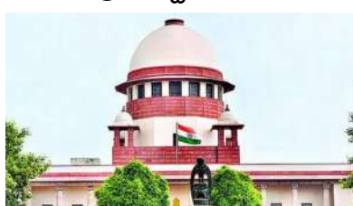
న్యూఢిల్లీ, మార్చి 22 : దేశవ్యాప్తంగా కిక్కిరి

సిన జైళ్ల తీరుపై సుప్రీంకోర్టు ఆందోళన వ్యక్తం చేసింది. జైళ్ల సామర్థ్యం ఎంత?, ఖైదీలు ఎంతమంది ఉన్నారు? జైళ్లలో ఖాళీగా ఉన్న షోర్టులు ఎందుకు భర్తీ చేయడం లేదు? అంటూ ప్రశ్నించింది. జైళ్ల సంస్కరణకు నిలయాలూ ఉండాలే తప్ప నరకకూపాలూ మారకూడదంటూ ఆగ్రహం వ్యక్తం చేసింది. జైళ్లలో స్థితి గతులపై దాఖలైన పిటిషన్లను సుమోట్లోగా విచారించిన ద్విసభ్య ధర్మాసనం కేంద్రంతోపాటు అన్ని రాష్ట్రాలు, కేంద్ర పాలిత ప్రాంతాలకు శనివారం కీలక