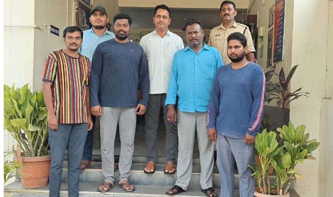
రేవంత్ రెడ్డి చెప్పిన మాటలు, మాటలకే వరకే పరిమితం అయ్యాయని విమర్శించారు. అక్రమ అరెస్టుల ద్వారా ప్రజా వ్యతిరేకత నుండి ప్రభుత్వం తప్పించుకోలేదని వారు స్పష్టం చేశారు. అక్రమ అరెస్టుల ద్వారా ప్రభుత్వాన్ని ఎన్నో రోజులు నడవలేదని వారు హితవు పలికారు. ప్రభుత్వం ఇకనైనా మే

జనోదయ, మందమర్రి మార్చి 24: బిఆర్ఎస్ పార్టీ ఇచ్చిన అసెంబ్లీ ముట్టడి పిలుపును పురస్కరించుకొని పట్టణంలోని బిఆర్ఎస్ నాయకులు ఛలో అసెంబ్లీకి వెళ్లకుండా ముందస్తుగా అరెస్ట్ చేసి పట్టణ పోలీస్ స్టేషన్ కు తరలించారు. రాష్ట్రంలోని కాంగ్రెస్ ప్రభుత్వం గత అసెంబ్లీ ఎన్నికల సందర్భంగా ఇచ్చిన 6 గ్యారంటీలు, 420 హామీలను వెంటనే అమలు చేయాలని డిమాండ్ చేస్తూ బిఆర్ఎస్ మంగళవారం అసెంబ్లీ ముట్టడికి పిలుపు నివ్వగా పట్టణంలోని బిఆర్ఎస్ నాయకులు హైదరాబాద్ కు వెళ్లకుండా సోమవారం రాత్రి అరెస్ట్ చేసి పోలీస్ స్టేషన్ కు తరలించారు. ఈ సందర్భంగా బిఆర్ఎస్ నాయకులు మాట్లాడుతూ అర్ధరాత్రి అక్రమ అరెస్టులను తీవ్రంగా ఖండించారు. ప్రజా ప్రభుత్వంలో ఎవరైనా స్వేచ్ఛగా తమ నిరసనలు తెలుపవచ్చు అని స్వయంగా సీఎం