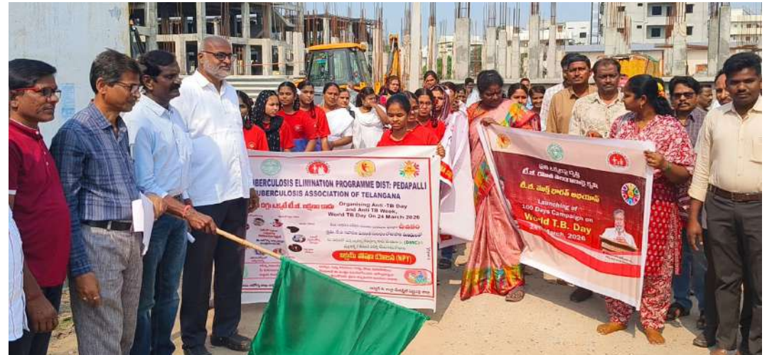
ట్యూబర్క్యులోసిస్ అనే సూక్ష్మక్రిమి వల్ల వస్తుందని, దగ్గు, తుమ్ము ద్వారా ఇతరులకు వ్యాపిస్తుందని వివరించారు. రెండు వారాలకు మించిన దగ్గు, జ్వరం, బరువు తగ్గడం, రాత్రిపూట చెమటలు వంటి లక్షణాలు ఉంటే వెంటనే పరీక్షలు చేయించుకోవాలని సూచించారు. సాధారణ టిబి రోగులకు 6 నెలల పాటు ఉచిత చికిత్స అందిస్తామని, డ్రగ్ రెసిస్టెంట్ టిబి రోగులకు 1-2 సంవత్సరాలపాటు ప్రత్యేక చికిత్స అవసరమని తెలిపారు. జిల్లాలో నిర్వహించిన నిక్షయ్ శివర్ కార్యక్రమంలో వేలాది మందికి పరీక్షలు నిర్వహించి, టిబి రోగులను గుర్తించి ఉచిత చికిత్స అందిస్తున్నామని వెల్లడించారు. ఈ కార్యక్రమంలో వైద్యులు, అధికారులు, ఎన్జీవోలు, ఆరోగ్య సిబ్బంది, పాల్గొన్నారు.