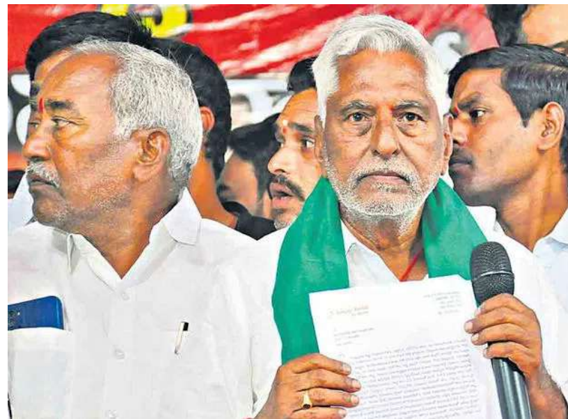
సీఎం రేవంత్ కారణమని దుయ్యబట్టారు. దీని ప్రభావం వల్లే సికింద్రాబాద్, మహబూబ్ నగర్ లోనూ కాంగ్రెస్ ఓటమి పాలైందని ఆరోపించారు.