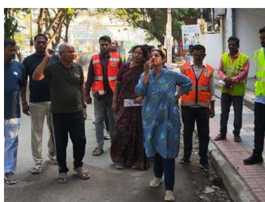
వాతావరణం కల్పించే దిశగా చర్యలు కొనసాగుతున్నాయి.

జనోదయ శేరిలింగంపల్లి, మార్చి 25 : మియాపూర్ సర్కిల్-48 పరిధిలోని మైత్రి నగర్ ప్రాంతంలో శానిటేషన్ కార్యకలాపాలను సిఎస్సీ కమిషనర్ పరిశీలించారు. ఈ ప్రాంతంలోని రోడ్లపై ఉన్న గుంతలు (పోత్ హోల్స్) పరిశీలించి, వాటి మరమ్మతులపై అధికారులకు తక్షణ చర్యలు తీసుకోవాలని సూచించారు. అలాగే మైత్రి నగర్ ఫేజ్-2 పార్క్ను సందర్శించి, పార్క్ నిర్వహణ, పరిశుభ్రత, పచ్చదనం పరిరక్షణపై సమీక్ష నిర్వహించారు. ప్రజలకు సౌకర్యవంతమైన వాతావరణం కల్పించేందుకు పార్క్ అభివృద్ధి పనులను మరింత మెరుగుపరచాలని సూచించారు. ప్రజలకు ఇబ్బంది లేకుండా ఫుట్ పాత్ ఆక్రమణలు సర్వీస్ రోడ్డ్ల వ్యాపార కార్యక్రమాలకు లేకుండా తనిఖీ చేయాలని, స్కూల్ లు, కాలేజీలు భవనాల అనుమతులు పరిశీలించాలని ఈ సందర్భంగా అధికారులకు ఆదేశాలు ఇచ్చారు. ఈ కార్యక్రమంలో డిప్యూటీ ఎగ్జిక్యూటివ్ ఇంజనీర్ (డిఈఈ), అసిస్టెంట్ ఎగ్జిక్యూటివ్ ఇంజనీర్ (సీఎస్సీ డబ్ల్యూ ఎం), సానిటేషన్ సూపర్వైజర్లు (ఎస్ఎస్) రావీకీ సంస్థ ప్రతినిధులు హాజరయ్యారు. అధికారులు మియాపూర్ సర్కిల్-48లో కొనసాగుతున్న శానిటేషన్ పనులు, ఫీల్డ్ స్టాయి అమలు పరిస్థితులను కమిషనర్ కు వివరించారు. ఈ తనిఖీ ద్వారా మియాపూర్ ప్రాంతంలో శానిటేషన్ వ్యవస్థను మరింత బలోపేతం చేయడానికి అధికార యంత్రాంగం కృషి చేస్తున్నట్లు స్పష్టమవుతోంది. రోడ్ల మరమ్మతులు, పార్కుల సంరక్షణ, చెత్త నిర్వహణ వంటి అంశాలపై దృష్టి సారించడం ద్వారా ప్రజలకు మెరుగైన జీవన