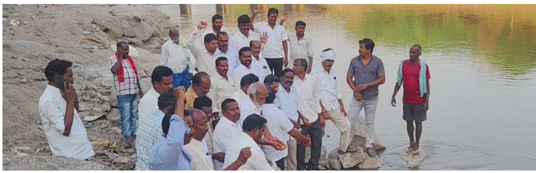
కాలువకు నీటిని విడుదల చేయాలని అధికారులను ఆదేశించారు. ఈ మేరకు గురువారం రామడుగు మండలం లక్ష్మీపూర్ గాయత్రి పంప్ హౌస్ నుండి అధికారులు వరద కాలువకు నీటిని విడుదల చేశారు. పొట్ట దశలో ఉన్న పంటలను కాపాడడానికి గోదారమ్మ వరద కాలువలో పరవళ్ళు తొక్కింది. చొప్పుదండి నియోజకవర్గం రైతులకు భరోసా కల్పిస్తూ వరద కాలువ నిండుగా ప్రవహించింది. దీంతో కొండన్నపల్లి కురిక్యాల గ్రామాల మధ్య వరద కాలువ మండలం కాంగ్రెస్ పార్టీ నాయకులు, రైతులు పెద్ద ఎత్తున చేరుకున్నారు. వరద కాలువలో పసుపు, కుంకుమ, పువ్వులు చల్లి గోదారమ్మకు స్వాగతం పలికారు. రైతుల సంక్షేమాన్ని దృష్టిలో పెట్టుకుని సకాలంలో వరద