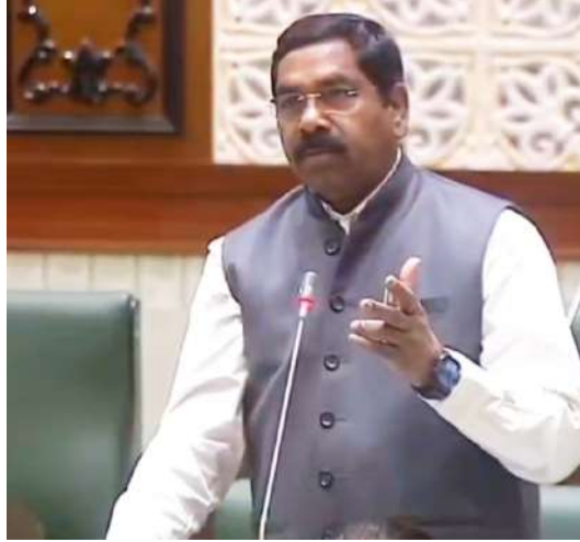
చి పెండింగ్ ఉందని, దీనిపై ప్రత్యేక దృష్టి సారించాలని కోరారు.

పనిచేశానని, ఈ అంశంపై గతంలో మాజీ ముఖ్యమంత్రిని కలిసి వినతి పత్రం అందజేశామని, ప్రస్తుతం రేవంత్ రెడ్డిని కలిసి కూడా వినతిపత్రం అందజేశామని, ట్రైనింగ్ నుండి సీనియర్లని ఫిక్స్ అవ్ చేస్తే, మహారాష్ట్ర, చెన్నై లాగా తీసుకొని ప్రమోషన్ చూస్తే బాగుంటుందని, ఈ అంశం యొక్క ఫైల్ పెండింగ్లో ఉందని, వెంటనే అంశంపై ప్రత్యేక చొరవ తీసుకోవాలన్నాడు. ఏఆర్ నుంచి సివిల్ కు కన్వర్షన్ అయ్యే కానిస్టేబుల్ల అంశం 2017 నుంచి