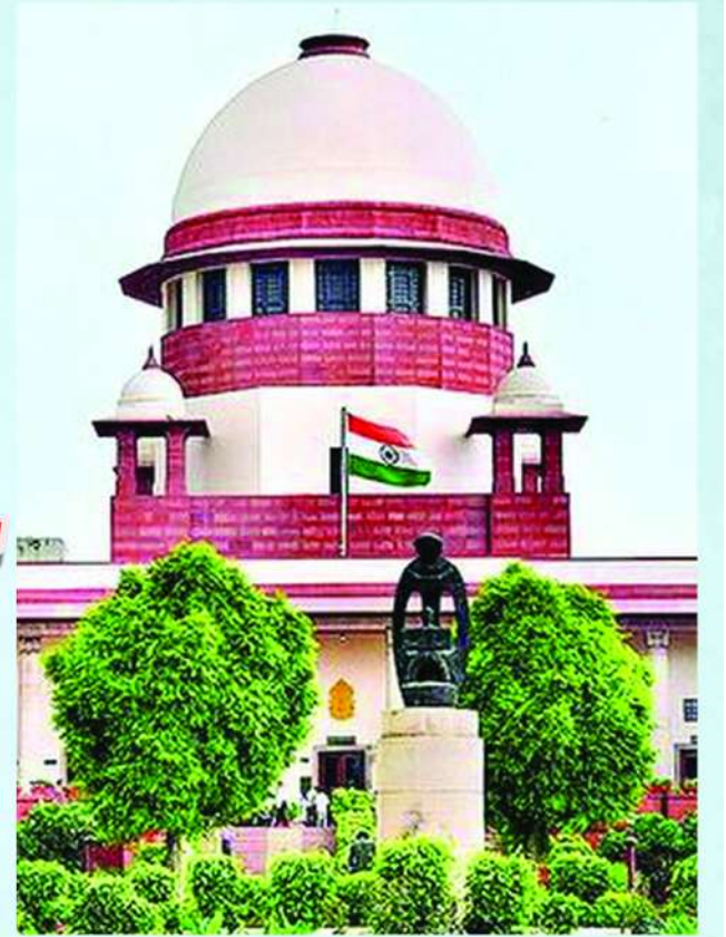
అన్ని ప్రభుత్వ ప్రైవేట్ పాఠశాలల్లోని విద్యార్థినులందరికీ ఉచితంగా శానిటరీ ప్యాప్స్ అందించాలని రాష్ట్రాలు, కేంద్ర పాలిత ప్రాంతాల ప్రభుత్వాలను సుప్రీంకోర్టు శుక్రవారం ఆదేశించింది. రుతుక్రమ పరిశుభ్రత రాజ్యాంగంలోని 21వ అధికరణ ప్రకారం జీవించే హక్కులో భాగమని తెలిపింది. అన్ని ప్రభుత్వ ప్రైవేట్ బడుల్లో బాలురకు, బాలికలకు వేర్వేరుగా, వికలాంగులకు ప్రత్యేక టాయిలెట్లు ఉండాలని పేర్కొన్నది.