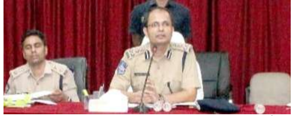
గంజాయి విక్రేతలను గుర్తించాలి..

అధికంగా చోరీలు జరిగే ప్రాంతాల్లో సీసీ కెమెరాలను ఏర్పాటు చేయాలని, అదే విధంగా ప్రజల భాగస్వామ్యంతో కాలనీలలో సీసీ కెమెరాలను ఏర్పాటు చేసేందుకు సంబంధిత అధికారులు కృషి చేయాలని, స్టేషన్ అధికారులు తమ పరిధిలో ఏర్పాటు చేసిన సీసీ కెమెరాలను ఎప్పటికప్పుడు జియో ట్యాగింగ్కు అనుసంధానం చేయాలని ఆదేశించారు.