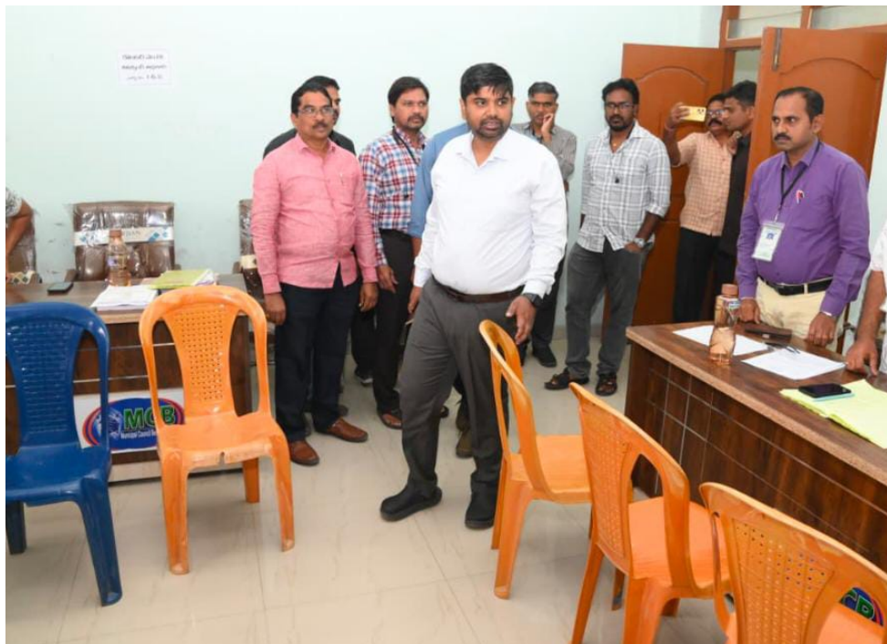
సూచించారు. విద్యాలయంలో చేపడుతున్న భోజనశాలను త్వరగా పూర్తి చేయాలని కోరారు. రేగుల గూడ నిర్మాణ పనులను పరిశీలించారు.