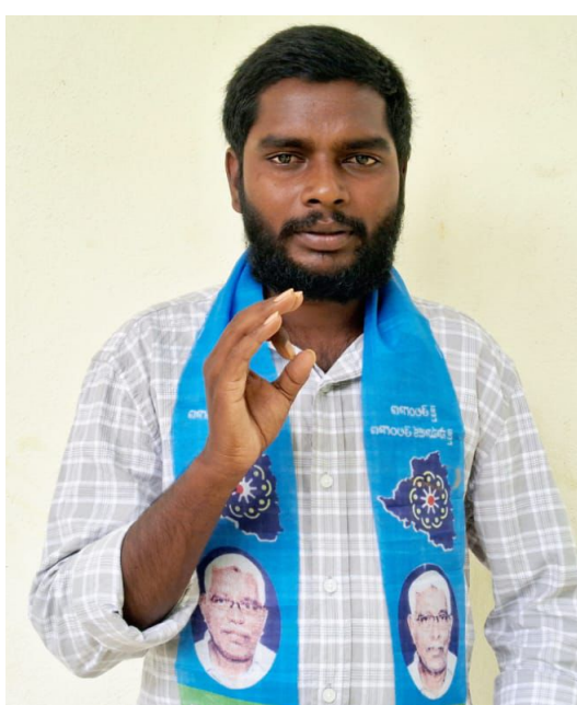
ద్యాసంస్థలు, నవోదయ పాఠశాలల ఏర్పాటు విషయంలో కేంద్ర ప్రభుత్వం నిర్లక్ష్యం వహించడం తెలంగాణ పట్ల వివక్షను సూచిస్తోందన్నారు. ఈ బడ్జెట్ విద్యార్థి, నిరుద్యోగ యువత ఆకాంక్షలకు పూర్తిగా వ్యతిరేకమని, విద్యారంగానికి తగిన నిధులు కేటాయిస్తూ బడ్జెట్ను పునఃసమీక్షించాలని ఆయన డిమాండ్ చేశారు.

విమర్శించారు. నిరుద్యోగ సమస్య తీవ్రంగా ఉన్నప్పటికీ, యువతకు ఉపాధి కల్పించే స్పష్టమైన కార్యాచరణ ఈ బడ్జెట్లో కనిపించడం లేదన్నారు. ప్రతి సం, రెండు కోట్ల ఉద్యోగాలు కల్పిస్తామని ఇచ్చిన హామీలు అమలు కాకపోవడంతో నిరుద్యోగ యువత తీవ్ర నిరాశలో ఉందన్నారు. నిత్యావసర వస్తువులపై జీఎస్టీ భారాన్ని తగ్గించకపోవడం వల్ల సామాన్య ప్రజలపై మరింత ఆర్థిక భారం పడుతోందన్నారు. వికసిత్ భారత్ నినాదాలకు విరుద్ధంగా, ప్రభుత్వ విశ్వవిద్యాలయాలు, కళాశాలలు, పాఠశాలలు మౌలిక వసతుల కొరత, అధ్యాపకుల ఖాళీలతో ఇబ్బందులు పడుతున్నా, వాటి అభివృద్ధికి అవసరమైన నిధులు కేటాయించడంలో ప్రభుత్వం విఫలమైందన్నారు. నూతన విద్యా విధానంలో ఉన్న లోపాలపై ఇప్పటికే స్పష్టత లేదని తెలిపారు. రాష్ట్ర విభజన హామీల ప్రకారం రాష్ట్రానికి కేటాయించాల్సిన, ఐఐఐటీ, ఐఐఐఎం, జాతీయ వి