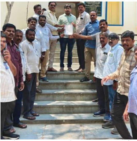
చేశారు. ఇప్పుడు మేమున్న స్థలాలలో యధావిధిగా మా ఇండ్లు మేము నిర్మించుకొనుటకు ప్రభుత్వం అనుమతిం చాలని తండా గిరిజన సంక్షేమ సంఘం నాయకులు డిమాండ్ చేశారు.

విఘాతం కలుగుతుందని వినతి పత్రంలో పేర్కొన్నారు. ప్రభుత్వం నుండి మాకు ఎలాంటి లబ్ధి కలగక పోయిన మాకు మేమే జీవనోపాధి కల్పించుకుని బతుకుతున్నాం. ఈ పరిస్థితుల్లో మరో ప్రాంతానికి తరలించి గృహ నిర్మాణం జరిపి మా జీవనోపాధికి ముప్పు చేయకండి, ప్రజా ప్రభుత్వం ఎన్నికల ముందు చేసిన వాగ్దానాలలో భాగంగా ఇందిరమ్మ ఇండ్లు అనే పథకం కింద పేదలు నివసిస్తున్న స్థలాలలో ఇండ్లు కట్టుకోవడానికి 5 లక్షల రూపాయలు ఇచ్చి ఇల్లు కట్టిస్తామని హామీని అమలు చేయాలని అందులో భాగంగామా తండా లో ఉన్న ప్రతి కుటుంబానికి 5 లక్షల చొప్పున ఇవ్వాలని డిమాండ్