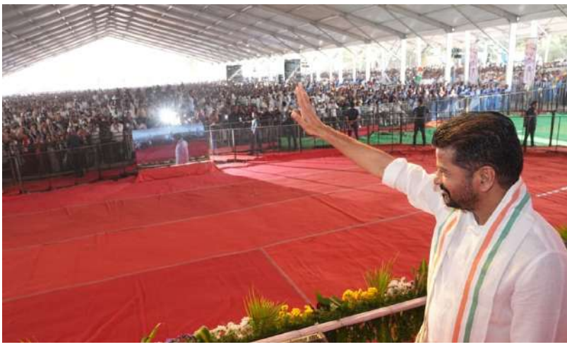
జనోదయ : చొప్పవండి, ఫిబ్రవరి 5: