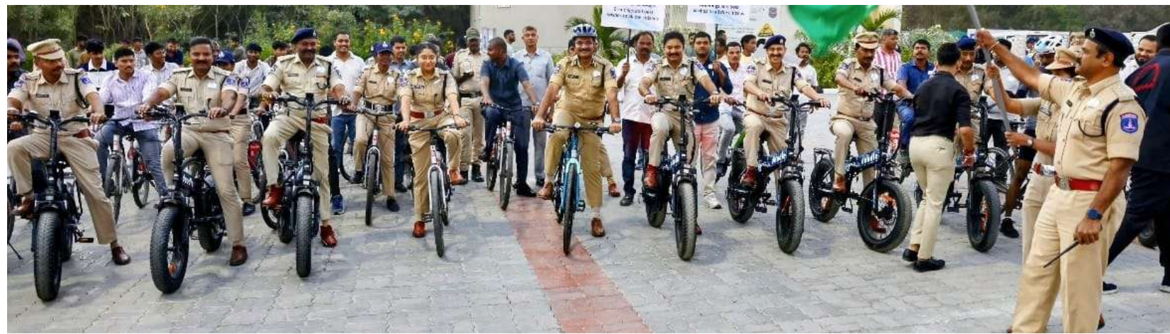
జనోదయ : శేరిలింగంపల్లి ఫిబ్రవరి 12:

సైబరాబాద్ పోలీస్ కమిషనరేట్ 24వ ఆవిర్భావ దినోత్సవాన్ని పురస్కరించుకుని గురువారం నార్సింగి సైకిల్ ట్రాక్పై సైబరాబాద్ పోలీసులు యువతతో కలిసి సైక్లింగ్ కార్యక్రమాన్ని నిర్వహించారు. ఈ కార్యక్రమం ద్వారా యువతలో సామాజిక బాధ్యత, భద్రతా అవగాహన ఆరోగ్య చైతన్యం పెంపొందించడమే ప్రధాన ఉద్దేశ్యంగా పెట్టుకున్నారు. ఈ సందర్భంగా పోలీసులు యువతతో ప్రత్యేక సమావేశం