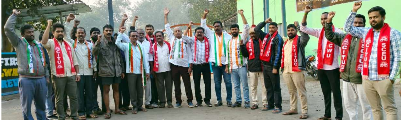
జనోదయ, మందమల ఫిబ్రవరి 12:

కేంద్రంలోని నరేంద్ర మోడీ ప్రభుత్వం అనుసరిస్తున్న రైతు, కార్మిక వ్యతిరేక విధానాలను నిరసిస్తూ జాతీయ కార్మిక సంఘాలు ఇచ్చిన దేశవ్యాప్త సమ్మె గురువారం సింగరేణిలో విజయవంతం అయింది. కార్మిక సంఘాల నాయకులు గనుల పైకి చేరుకొని కార్మిక చట్టాల మార్పుతో కార్మిక వర్గంపై ప్రభుత్వం దాడి చేస్తుందని దీనికి నిరసనగా కార్మిక సంఘాలు దేశ వ్యాప్తంగా సమ్మెకు పిలుపు నిచ్చాయని సింగరేణి కార్మికులు సమ్మెలో పాల్గొనాలని కోరడంతో కార్మికులు స్వచ్ఛందంగా సమ్మెలో పాల్గొన