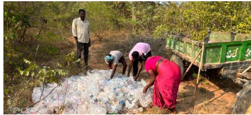
జనోదయ,బెల్లంపల్లి, ఫిబ్రవరి 18: