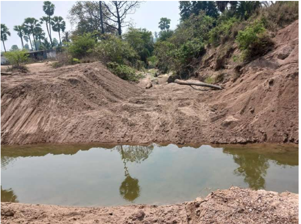
మిడ్ మానేర్ డ్యామ్ కుడి కాలువ 61.84 కిలోమీటర్ల దగ్గర ఇసుక మేటలను / పూడికను తొలగించిన దృశ్యం

సిరిసిల్ల జిల్లా, బోయినపల్లి మండలం, మనువాడ గ్రామం దగ్గర మానేర్ నదిపై నిర్మాణమైన "మిడ్ మానేర్ డ్యామ్" (ఎంఎండి) అలాగే కరీంనగర్ పక్కన ఉన్నలోయర్ మానేర్ డ్యామ్ (ఎల్ఎండి)లో నీళ్లు నింపడం జరుగు తుంది. 2010 ఆగస్ట్ నుండి శ్రీరాంసాగర్ వరద కాలువ పూర్తి స్థాయిలో వనియోగం లోకి వచ్చింది. గోదావరి నదీ ప్రవాహం నీరును శ్రీరాంసాగర్ వరద కాలువ ద్వారా రోజుకు గరిష్ట స్థాయిలో "22,000 క్యూసెక్ ల నీటి" (క్యూసెక్ అంటే? క్యూబిక్ ఫీట్ సెకండ్