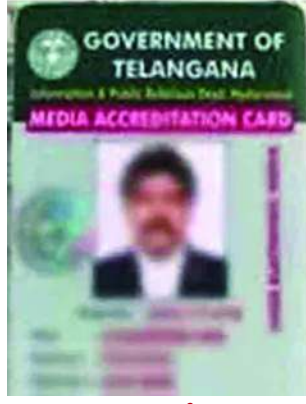
'అక్రిడేషన్ కమిటీలో ఆంధ్రా జర్నలిస్టులను నియమించడంలోని ప్రభుత్వ అంతర్వేదిక? తెలంగాణలో సమర్థులైన పాత్రికేయులు లేరా?' అని అందోల్ మాజీ ఎమ్మెల్యే క్రాంతికెరణ్ ప్రభుత్వాన్ని సూటిగా ప్రశ్నించారు. కేసీఆర్ హయాంలో అక్రిడేషన్ జారీ విషయంలో నిర్దిష్టమైన పాలసీని తీసుకు న్నా మని శుక్రవారం ఒక ప్రకటనలో స్పష్టం చేశారు. ఎవరైతే వరుసగా పదిహేనేండ్లు జర్నలిస్టు గా పనిచేస్తున్న వారిని ఫ్రీలాన్స్ కోటా అక్రిడేషన్ కు అర్హులుగా నిర్ణయించామని, వారు ఎలాంటి డాక్యు మెంట్లను సమర్పించాల్సిన అవసరం లేకుండా చేశా మని, ఎవరైతే పదేండ్లు ప్రింట్ లేదా ఎలక్ట్రానిక్ మీడియాలో పనిచేసిన జర్నలిస్టు, ఏదైనా యూ ట్యూబ్, వెబ్సైట్లో పనిచేసినా

ప్రధాన పత్రికలకు తగ్గించాల్సిన అవసరమేంటి? : క్రాంతికెరణ్