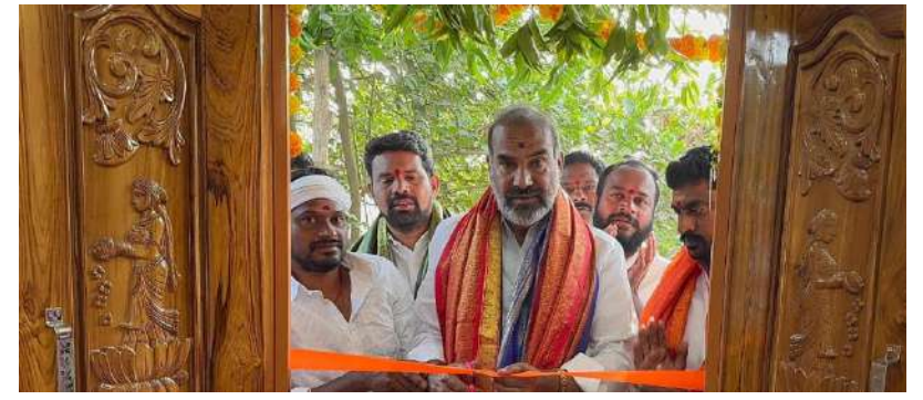
జనోదయ : వేములవాడ

వేములవాడ పట్టణంలో 14, 19 వార్డుల్లో నిర్మించిన ఇందిరమ్మ ఇల్లు గృహప్రవేశ కార్యక్రమంలో శుక్రవారం రాష్ట్ర ప్రభుత్వ విప్, వేములవాడ ఎమ్మెల్యే ఆది శ్రీనివాస్ పాల్గొన్నారు. లబ్ధిదారులకు నూతన వస్త్రాలను అందజేసి శుభాకాంక్షలు తెలిపారు. పేదల సొంతింటి కలను నిజం చేయడం ప్రభుత్వ ధ్యేయమని అన్నారు. ఈ కార్యక్రమంలో ప్రజాప్రతినిధులు, నాయకులు, కార్యకర్తలు, లబ్ధిదారులు పాల్గొన్నారు.