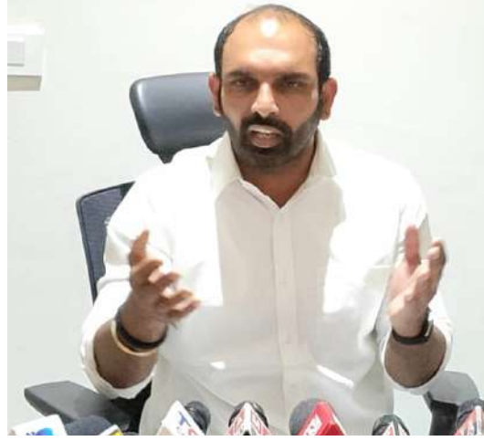
పాపాలని, లేకపోతే కఠిన చర్యలు తీసుకుంటామని హెచ్చరించారు. “సత్యమే గెలుస్తుంది-అసత్య ప్రచారాలకు చట్టపరంగా సమాధానం ఇస్తాం” అని అన్నారు.

ఆరోపిస్తూ, రాజకీయ కక్షతో తన ప్రతిష్ఠను దెబ్బతీయాలని ప్రయత్నిస్తున్నారని పేర్కొన్నారు. అక్రమ వసూళ్లపై తన వద్ద ఆధారాలు ఉన్నాయని, చట్టపరంగా చర్యలు కొనసాగుతాయని స్పష్టం చేశారు. తక్షణమే బహిరంగ క్షమాపణ చెప్పాలని, లేకపోతే కఠిన చర్యలు తీసుకుంటామని హెచ్చరించారు. “సత్యమే గెలుస్తుంది-అసత్య ప్రచారాలకు చట్టపరంగా సమాధానం ఇస్తాం” అని అన్నారు.