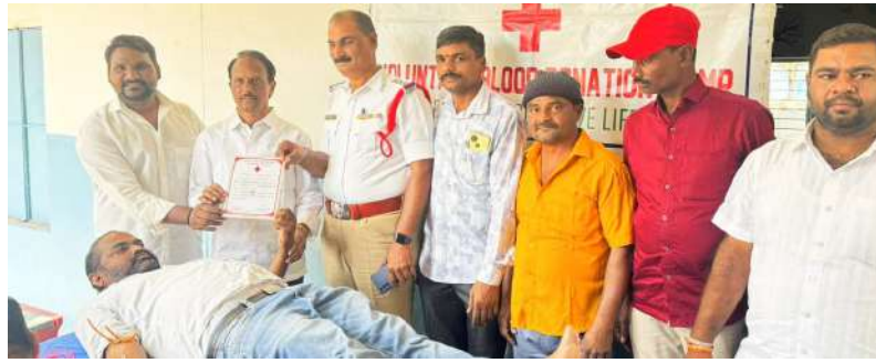
వరంగల్ జిల్లా ప్రతినిధి: (జనోదయ) ఫిబ్రవరి 22

-ఓన్ ఫ్లీట్ కార్ డ్రైవర్స్ అసోసియేషన్ ఆధ్వర్యంలో -రక్తదాన శిబిరం తో పాటు ఐడి కార్డుల పంపిణీ