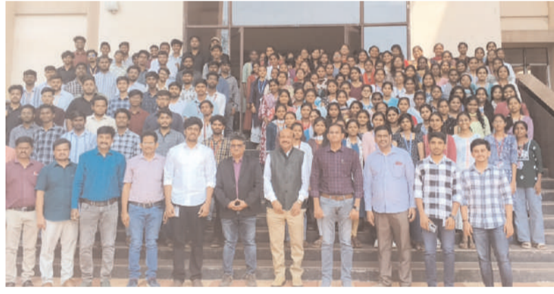
విద్యార్థులతో పాటు మొత్తం 183 మంది విద్యార్థులు పాల్గొంటున్నారు.