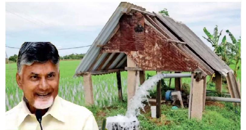
సౌకర్యం లభించే అవకాశం ఉందనే ఒక చర్చ సాగుతోంది.

క్రైమ్ కౌంటర్ న్యూస్ : అమరావతి, మార్చి 02: కూటమి ప్రభుత్వం తీసుకున్న తాజా నిర్ణయంతో ఏపీలో రైతులకు ఊరట లభించింది. పెండింగ్ లో ఉన్న 46,113 వ్యవసాయ విద్యుత్ కనెక్షన్ల ఏర్పాటుకు రాష్ట్ర ప్రభుత్వం గ్రీన్ సిగ్నల్ ఇచ్చింది. అందుకు సంబంధించిన ఆదేశాలు సోమవారం జారీ చేసింది. ఈ నెలాఖరులోగా అనుమతులు జారీ చేయాలని ఆ ఆదేశాల్లో స్పష్టం చేసింది. మొత్తం పెండింగ్ దరఖాస్తులు: 46,113 ఉండగా.. వీటికి రూ. 250 కోట్ల మేర ఖర్చు అవుతుందని అంచనా వేస్తున్నారు. రాష్ట్రంలో వ్యవసాయ కనెక్షన్లు మొత్తం 22.30 లక్షలు ఉన్నాయి. కొత్తగా ఇప్పటికే 1.12 లక్షల కనెక్షన్లు మంజూరు చేసింది. పెండింగ్ లో ఉన్నవి క్లియర్ చేయడానికి మరో 10,000 ట్రాన్స్ ఫార్మర్లు కేటాయించనుంది. ఈ పెండింగ్ లో ఉన్న కనెక్షన్లను రెండు నెలల్లో పూర్తి చేయాలని డిస్కంలను విద్యుత్ శాఖ మంత్రి ఆదేశించారు. ప్రభుత్వం తీసుకున్న ఈ నిర్ణయంతో సాగు సీజన్ కు ముందే వేలాది మంది రైతులకు విద్యుత్