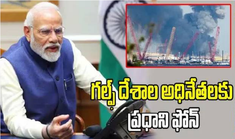
గల్ఫ్ దేశాల అభినేతలకు ప్రధాని ఫోన్

ఇంటర్నెట్ డెన్యూ : మధ్య ప్రాచ్యంలో ఉద్రిక్తతలు అంతకంతకూ పెరుగుతున్న నేపథ్యంలో ప్రధాని మోదీ అరబ్ దేశాల అభినేతలతో ఫోన్లో చర్చలు జరిపారు. గల్ఫ్ దేశాలపై దాడులు జరుగుతున్న వైనంపై ఆందోళన వ్యక్తం చేశారు. అక్కడి భారతీయుల భద్రత, సంక్షేమంపై కూడా చర్చించారు. ఓమాన్ సుల్తాన్ హైతమ్ బిన్ తారిఫ్, కువైత్ యువరాజు షేఖ్ సబా, ఖతర్ ఎమిర్ షేఖ్ తమీమ్లతో ప్రధాని ఫోన్లో మాట్లాడారని అధికార వర్గాలు తెలిపాయి. ఇటీవల బ్రాహ్మాయిన్, సౌదీ అరేబియా పాలకులతో కూడా ప్రధాని మోదీ మాట్లాడారు. గల్ఫ్ దేశాలపై జరుగుతున్న దాడులను ఖండించారు. ఈ దాడులు గల్ఫ్ దేశాల సార్వభౌమత్వాన్ని ఉల్లంఘించడమేనని స్పష్టం చేశారు. ఈ క్షిప్ర సమయంలో భారత్ గల్ఫ్ షౌరులకు అండగా ఉంటుందని కూడా హామీ ఇచ్చారు. జోర్డాన్ రాజుతో కూడా మాట్లాడిన ప్రధాని మోదీ సంఘభావాన్ని ప్రకటించారు. యూఏఈ అధ్యక్షుడు, ఇజ్రాయేలీ ప్రధానితో కూడా మాట్లాడి అక్కడి పరిస్థితి గురించి ఆరా తీశారు. పశ్చిమాసియా, గల్ఫ్ దేశాల్లో సుమారు 90 లక్ష మంది భారతీయులు నివసిస్తున్నారు. ఇరాన్లో 10 వేల మంది చదువు, ఉద్యోగాల కోసం ఉంటుండగా, ఇజ్రాయేల్లో 40 వేల మంది భారతీయులు ఉంటున్నారు. ప్రస్తుతం పశ్చిమాసియా గగనతలం మీదుగా విమానాల రాకపోకలు దాదాపుగా నిలిచిపోయాయి. దీంతో, అనేక మంది భారతీయులు దుబాయ్, దోహా సహా పలు ప్రాంతాల్లో చిక్కుకుపోయారు. ఈ విషయమై అధికారం కేబినెట్ కమిటీ కూడా సమావేశమై చర్చించింది.