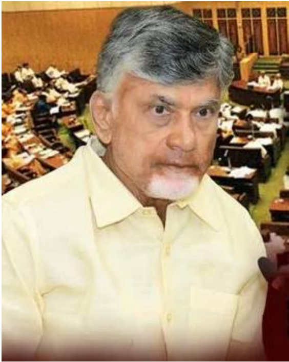
అమరావతి, ఫిబ్రవరి 04 క్రైమ్ కౌంటర్ న్యూస్: ఆంధ్రప్రదేశ్ రాష్ట్రంలో 2026-27 ఆర్థిక సంవత్సరానికి సంబంధించిన బడ్జెట్ కనరత్తు ముమ్మరంగా సాగుతోంది. ఆర్థిక శాఖ మంత్రి పయ్యూవుల కేశవ్ నేతృత్వంలో ఆ

శాఖ అధికారులు ఈ ప్రక్రియను వేగవంతం చేశారు. ఈనెల 14వ తేదీన 2026-27 ఆర్థిక సంవత్సరానికి గాను బడ్జెట్ను మంత్రి పయ్యూవుల కేశవ్ ఏపీ అసెంబ్లీలో ప్రవేశపెట్టనున్నారు. బడ్జెట్ కనరత్తులో భాగంగా ఆర్థిక మంత్రి వరుసగా ప్రీ-బడ్జెట్ సమావేశాలు నిర్వహిస్తున్నారు. ఇప్పటివరకు ఐదు శాఖలకు చెందిన మంత్రులతో సమావేశాలు పూర్తయ్యాయి. మంత్రులు బీసీ జనార్ధన్ రెడ్డి, గొట్టిపాటి రవి కుమార్, నిమ్మల రామానాయుడు, అచ్చెన్నాయుడు, అనితలతో వరుస సమావేశాలు జరిపారు. ఈ సమావేశాల్లో ఆయా శాఖలకు నిధుల కేటాయింపులు, ప్రాధాన్యతలపై విస్తృతంగా చర్చలు జరిగాయి. వివిధ శాఖల మంత్రులు తమ ప్రతిపాదనలను ఆర్థిక మంత్రికి సమర్పించారు. సంక్షేమం, అభివృద్ధికి సమపాక్షంలో నిధులు కేటాయించేలా ఆర్థిక శాఖ కనరత్తు చేస్తోంది. కేంద్ర ప్రభుత్వం నుంచి వచ్చే నిధులను దృష్టిలో ఉంచుకుని బడ్జెట్ను రూపొందిస్తున్నారు. ఈసారి బడ్జెట్లో ఇరిగేషన్ ప్రాజెక్టులు, ఉత్తరాంధ్ర-రాయలసీమ ప్రాంతాల అభివృద్ధి ప్రాజెక్టులకు అధిక ప్రాధాన్యత ఇవ్వనున్నట్లు తెలుస్తోంది. ముఖ్యంగా రాజధాని అమరావతి నిర్మాణానికి అవసరమైన నిధులను కేటాయించేలా బడ్జెట్ కూర్చు సాగుతోంది. పారిశ్రామిక రంగాన్ని ప్రోత్సహించేందుకు ప్రత్యేక