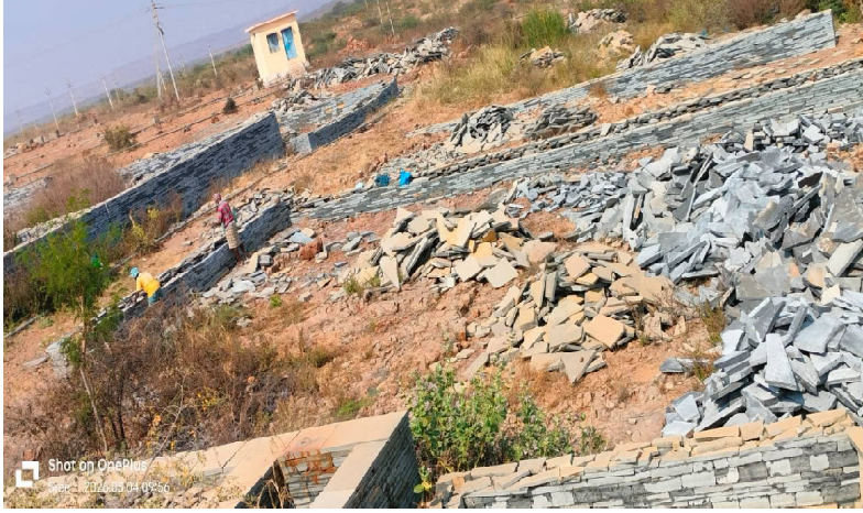
క్రైమ్ కౌంటర్ స్టాఫ్ :కొలిమిగుండ్ల ప్రభుత్వ భూముల్లో అసాధికారకంగా అక్రమ కట్టడాలు కడుతున్న చూసి చూడనట్లు వ్యవహరిస్తున్న కొలిమిగుండ్ల మండల

అధికారులు ప్రభుత్వ భూములను పరిరక్షించాలని ప్రజల ఆవేదన కొలిమిగుండ్ల మండల ఎమ్మార్వో ఆఫీస్ కూత వేటు దూరంలోని ఇటిక్యాల గ్రామం పాలకేంద్రం సమీపంలో గల 112వ ౧12బి ప్రభుత్వ స్థలంలో ఎటువంటి పట్టాలు లేకపోయినా అసాధికారకంగా అక్రమ కట్టడాలు కడుతూ ఒక్కొక్కరు దాదాపుగా ప్రభుత్వ స్థలాలను 30 సెంట్లు 40 సర్వే సెంట్లు సర్వే నెంబర్లలో ఆక్రమించుకొని ఐదారు ఇల్లు కడుతున్నారని ప్రజలు పలుమార్లు అధికారుల దృష్టికి తీసుకెళ్లిన ఎటువంటి చర్యలు తీసుకోవోగా వారికి ప్రోత్సాహం అందిస్తున్నారని ప్రభుత్వ స్థలాల్లో ఇల్లు లేని నిరుపేదలకు సెంటు స్థలం కూడా లేకుండా ఇలా అక్రమంగా దౌర్జన్యంగా ఆక్రమించుకుని అసాధికారకంగా అక్రమ కట్టడాలు కడుతున్న అధికారులు స్పందించకుండా చూసి చూడనట్లు వ్యవహరిస్తున్నారని ఇకనైనా జిల్లా ఉన్నత అధికారులు స్పందించి అసాధికారకంగా అక్రమ కట్టడాలు కడుతున్న వారిపై చర్యలు తీసుకొని అక్రమ కట్టడాలను ఆపి లేని నిరుపేద ప్రజలకు పట్టాలు పంపిణీ చేయాలని బుధవారం ప్రజలు జిల్లా ఉన్నతాధికారులను కోరారు