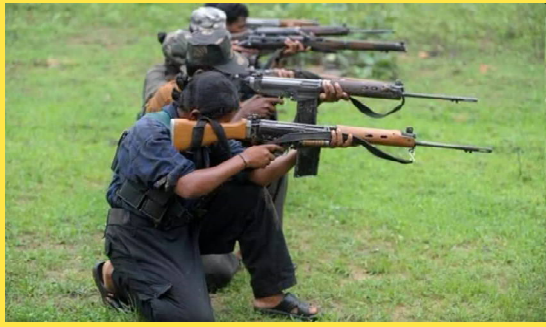
ఎన్కౌంటర్లో ఏడుగురు మావోయిస్టులు..

సంపుటి : 02 సంచిక : 148 గుంటూరు, శనివారం 07-02-2026 పేజిలు : 4 వెల. 2/-